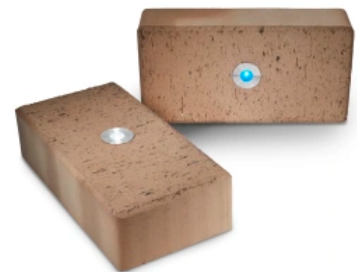
Penter Pflasterklinker mit LED