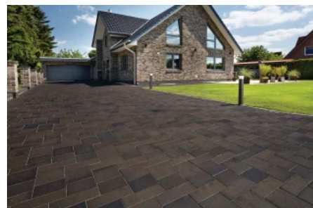
Penter Formatmix Titan