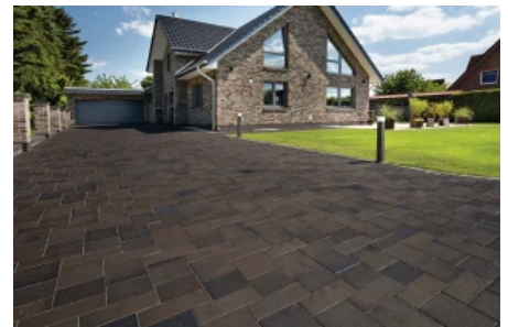
Penter Formatmix Titan