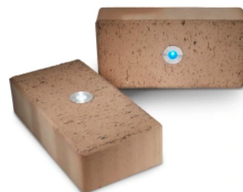
Penter Pflasterklinker mit LED