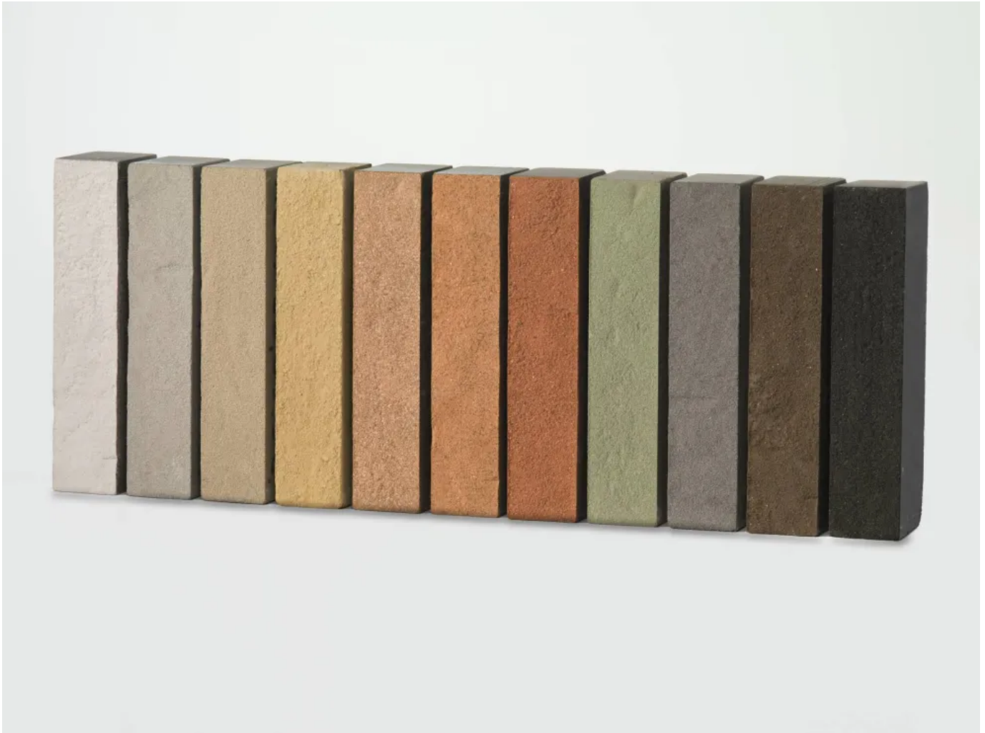
Pirrouet®: Mit elf Farben nachhaltig am Start

Aus der Serie Fassade: Verblender / Vormauerziegel / Klinker von Vandersanden