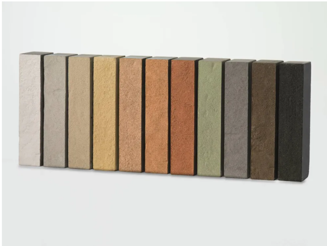
Pirrouet®: Mit elf Farben nachhaltig am Start

Aus der Serie Fassade: Verblender / Vormauerziegel / Klinker von Vandersanden