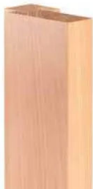
Tür geschlossen: Von außen kaum sichtbar ist das Türband in Zarge und Tür eingelassen.

Puristische Optik beim neuen „PIVOTA® FX2 80 3-D“: Magnetisch gehaltene Abdeckplatten verdecken die Schraubenbereiche bei dem verdeckt liegenden Band für gefälzte Normtüren im Innenbereich.