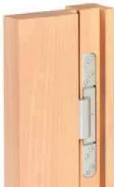
Tür 90° geöffnet: Durch den Bewegungsablauf wird die hintere Türkante geringfügig von der Zargenkante abgehoben.