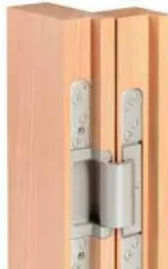
Tür 180° geöffnet: Die komplette Öffnung gestattet freien Durchgang ohne jegliche Einschränkung.