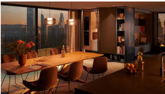
REVEGO als Baranwendung