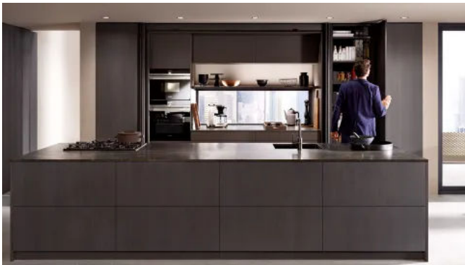
REVEGO öffnet bei Bedarf großzügige Arbeitsflächen in der Küche.