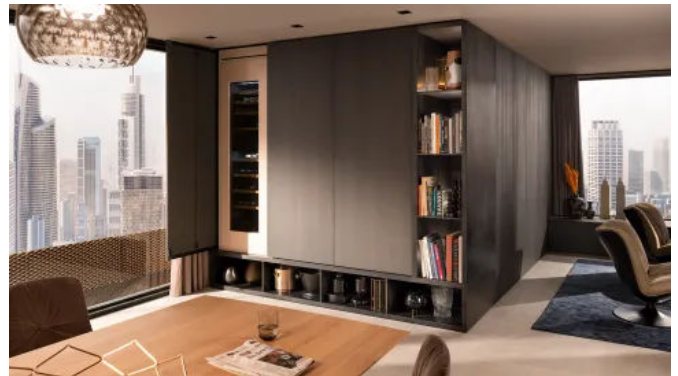
REVEGO bietet auch für den Wohnbereich Impulse.