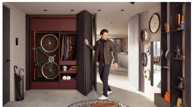
REVEGO Lösung in der Diele