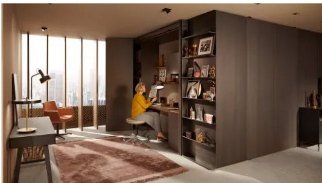
REVEGO geöffnet - Homeoffice im Wohnbereich