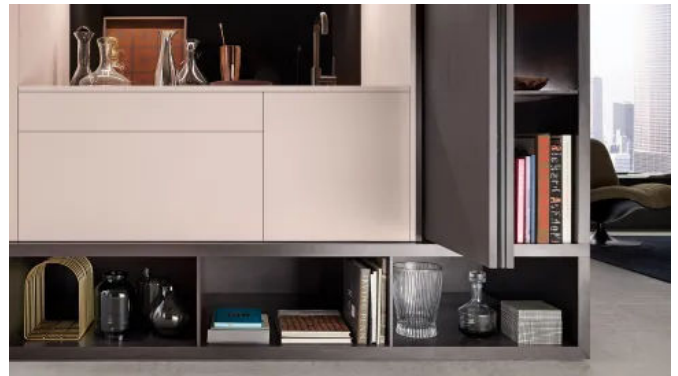
REVEGO ist als Einzel- und Doppeltüranwendung und mit unterschiedlichen Sockelvarianten realisierbar.