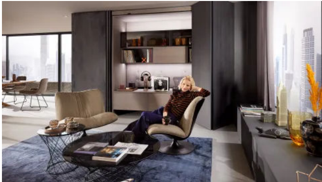
REVEGO im Wohnzimmer

Aus der Serie Klappen-, Scharnier-, Auszugs- und Pocketsysteme, Bewegungstechnologie von Julius Blum