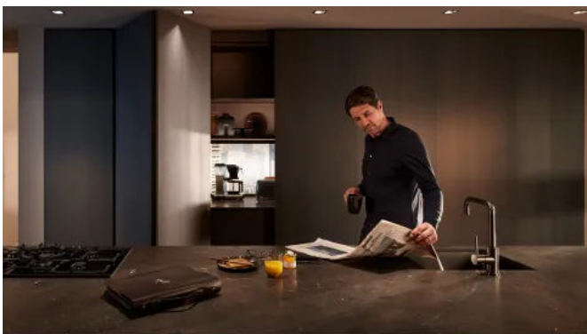
REVEGO duo: Wenn nicht benötigt, werden mit REVEGO Arbeitsbereiche ganz schnell wieder verborgen.