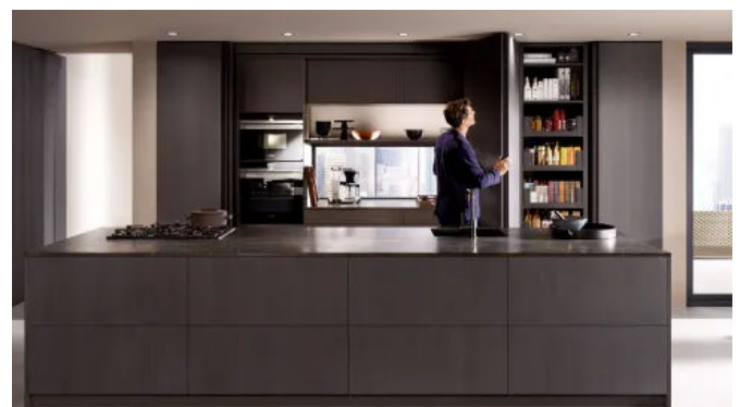
Im geöffneten Zustand ist die Küchenzeile sicht- und nutzbar.

REVEGO, das Einschiebetürsystem für Einzel- und Doppeltüranwendungen bietet eine im Pocket vollständig integrierte Scharnier-Technik und lässt sich bequem ins Küchenlayout oder die Möbelzeile eingliedern.