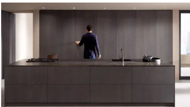
Im geschlossenen Zustand ist die Küchenzeile nicht zu sehen.