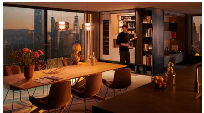
Mit REVEGO ist die Hausbar mit nur einem Handgriff geöffnet.