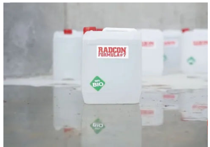
Radcon Formula #7®

Radcon Formula #7® ist ein vollständiger Ersatz für eine Membran, da es sowohl die Betonmatrix selbst als auch Risse abdichtet, selbst wenn diese hohen thermischen Beanspruchungen ausgesetzt sind. Das in den Beton eingedrungene Produkt bleibt dauerhaft reaktiv und reagiert mit Feuchtigkeit immer wieder neu.