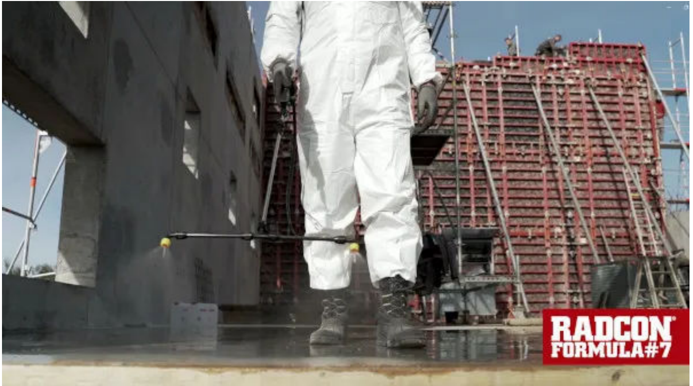
Film Radcon Formula #7®

Aus der Serie Abdichtung von Betonflächen - Hydrophobierung mit Silikatlösung von Evershield