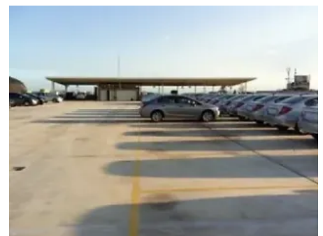
Radcon Formula #7® Anwendung — Parkplatz