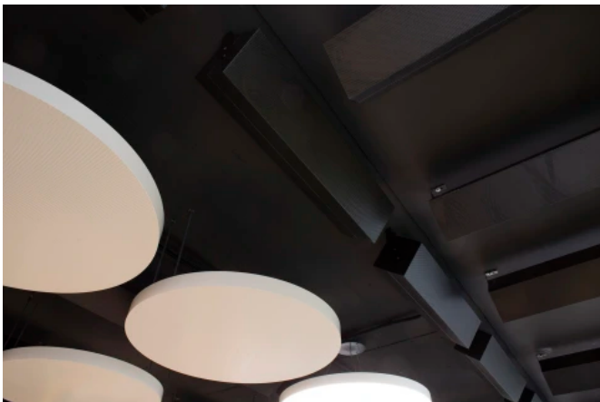
dur-SONIC CUBE, Foto: Thomas Krauss

Es können Absorptionswerte von bis zu 0,85 [Alpha w] erreicht werden. Dabei muss bei der Platzierung der einzelnen Absorberelemente nicht auf eine starre Anordnung geachtet werden. Sie können unauffällig im Deckenhohlraum untergebracht werden.