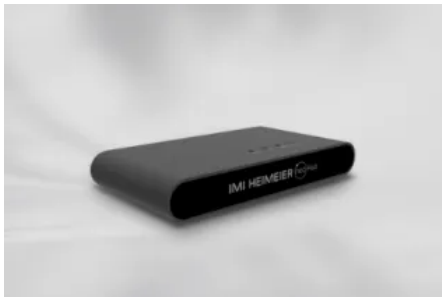
Der neoHub stellt die WLAN Verbindung zu neoStat- und neoAir-Raumthermostaten her.