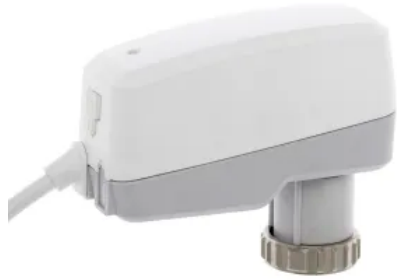
TA-Slider 500: Digital konfigurierbarer stetiger Push-Stellantrieb – 500 N.

Aus der Serie IMI HEIMEIER: Thermostatische Regelung von IMI Hydronic Engineering Deutschland