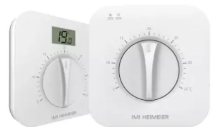
Manuelle Raumthermostate für thermische Stellantriebe in der Heizungs-, Lüftungs- und Klimatechnik