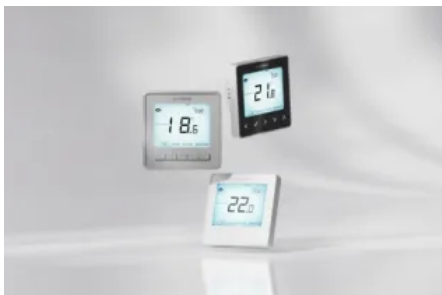
neo ist ein smartes Raumtemperatur-Regelsystem für Heizkörper und Fußbodenheizungen.

Die smarten neo Raumthermostate vereinen technisches und intuitives Design. neo Raumthermostate können Standalone oder als Teil eines smarten Heizungssystems eingesetzt werden.