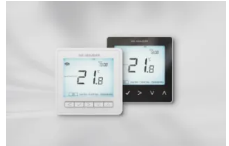
Die smarten neo Raumthermostate vereinen technisches und intuitives Design.