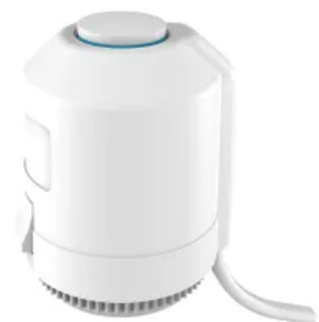
Der thermische Stellantrieb EMOTec ist einsetzbar zur Temperatur- und / oder zeitbezogenen 2-Punkt-Regelung.