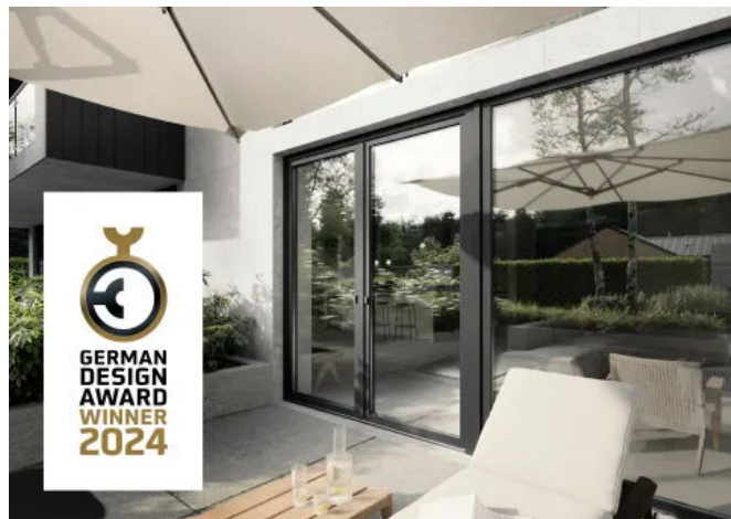
REHAU Premium-Fenstersystem ARTEVO