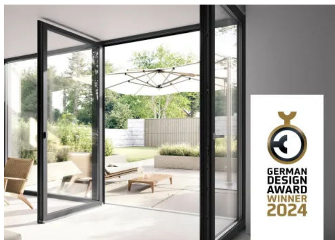
REHAU Premium-Fenstersystem ARTEVO

90 % aller ARTEVO Elemente kommen ohne Stahlarmierung aus, Wärmebrücken können so gar nicht erst entstehen. Dadurch werden U_f -Werte von bis zu 0,97 \text{ W}/(\text{m}^2\text{K}) erreicht.