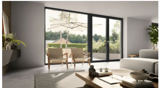
REHAU Premium-Fenstersystem ARTEVO

Klare und kantige Konturen sorgen für Ästhetik. Besonders schmale Ansichten sowie die schlanke Mittelpartie vergrößern die Glasflächen zusätzlich und eröffnen neue architektonische Möglichkeiten.