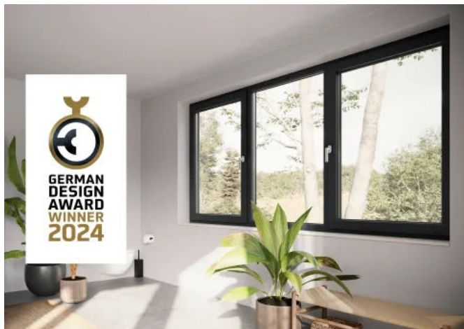
REHAU Premium-Fenstersystem ARTEVO

Aus der Serie REHAU Fenstersysteme von REHAU Window Solutions