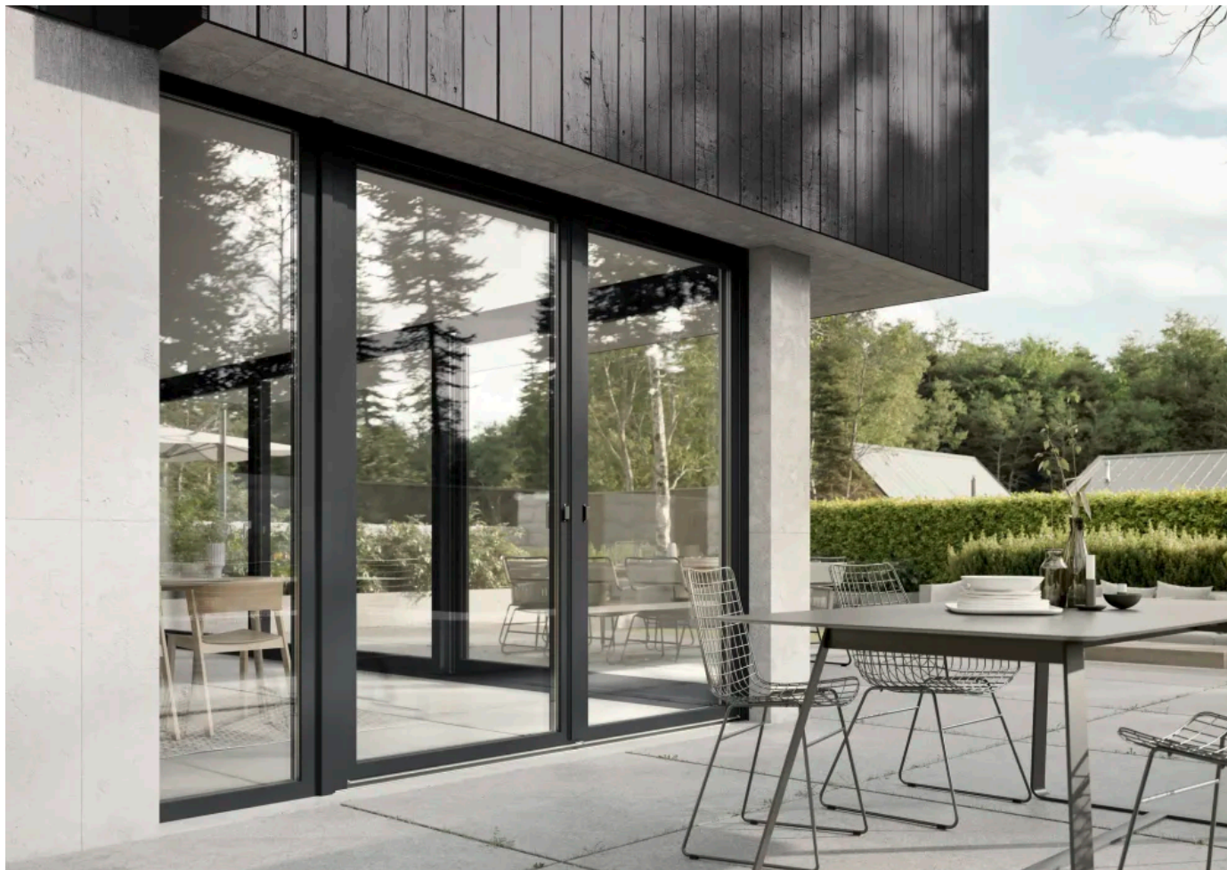
REHAU Premium-Fenstersystem ARTEVO

Aus der Serie REHAU Fenstersysteme von REHAU Window Solutions