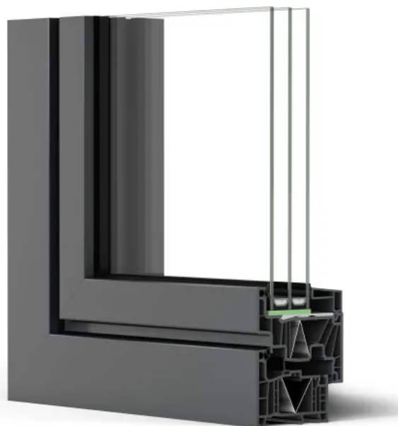
REHAU Premium-Fenstersystem ARTEVO in der flächenbündigen Variante: klares, kantiges Design im Aluminium-Look

Der Einsatz der LowE Folie sorgt für eine nachhaltige Lösung für passivhaus-zertifizierte Elemente. Da keinerlei Dämmschäume zum Einsatz kommen, kann die LowE Folie problemlos dem Recyclingprozess zugeführt werden.