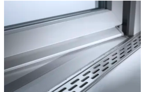
Bodengleiche Schwelle RAUCERO

Die bodengleiche Schwelle RAUCERO von REHAU besitzt 0 mm Aufbauhöhe, sodass Widerstände oder Stolperfallen bei der Balkon- oder Haustüren vermieden werden. Die leichte Überrollbarkeit sorgt für guten Komfort. Durch die integrierte Absenkdichtung werden Schlieren auf dem Boden oder auf der Schwelle vermieden. Der leicht herausnehmbare Edelstahlrost macht die Reinigung einfach.