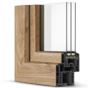
Farbbeispiel KALEIDO WOODDEC