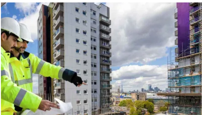
Eine hinterlüftete Fassade mit Rockpanel A2 Fassadenplatten erhöht die Brandsicherheit des Gebäudes.