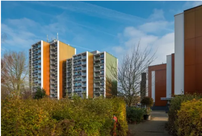
Rockpanel Fassadenplatten können auf vielfältige Weise montiert werden.