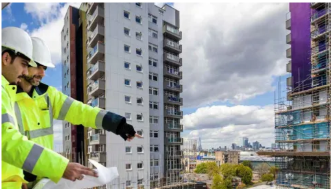
Eine hinterlüftete Fassade mit Rockpanel A2 Fassadenplatten erhöht die Brandsicherheit des Gebäudes.