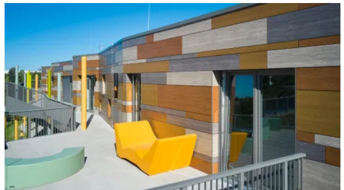
Rockpanel Platten und Profile sind in nahezu allen RAL/NCS Farben passend zum Design erhältlich.