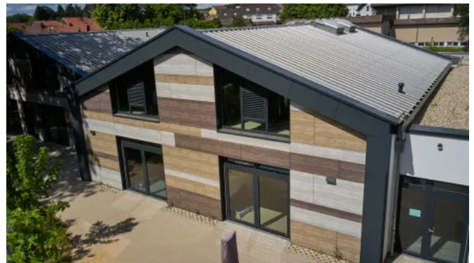
Rockpanel A2 Fassadenplatten sind geeignet, wenn eine hohe Brandsicherheit wünschenswert oder vorgeschrieben ist.