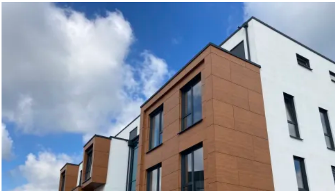
Rockpanel Fassadenplatten lassen sich mit schmalen Fugen montieren.