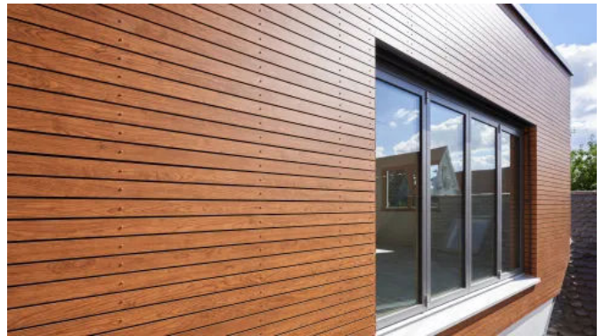
Die Holzdesigns von Rockpanel Woods weisen keine optischen Wiederholungen auf.