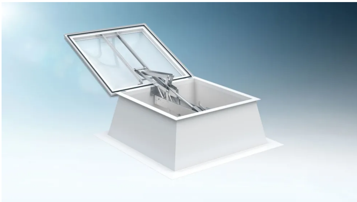
Elektrische DIN-RWA-Komponenten für Lichtkuppeln

Die elektrischen DIN-RWA-Komponenten ermöglichen neben der täglichen Lüftung auch ein sicheres und leistungsstarkes Öffnen der Lichtkuppeln im vorbeugenden Brandschutz. Für die verschiedenen Einsatzfälle werden entsprechend ausgelegte Systemlösungen – vom Einzelbeschlag Firejet® 165J SA über das RWA-Set für die Treppenraum-Entrauchung bis hin zum kompletten RWA-System angeboten.