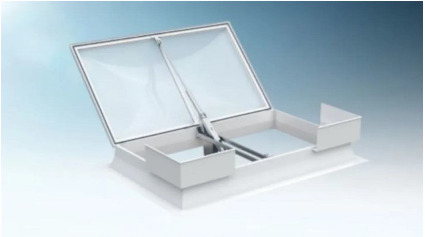
Pneumatische RWA-Komponenten für Lichtkuppeln

Der pneumatische DIN-RWA-Beschlag Firejet® 165J AZ für Lichtkuppeln garantiert ein sicheres Öffnen der Tageslichtelemente im Brandfall. Der RWA-Beschlag bietet eine hohe Funktionssicherheit, da er stromunabhängig funktioniert und deshalb selbst bei einem totalen Stromausfall zuverlässig öffnet. Zudem ist er nach DIN EN 12101-2 geprüft und zugelassen.