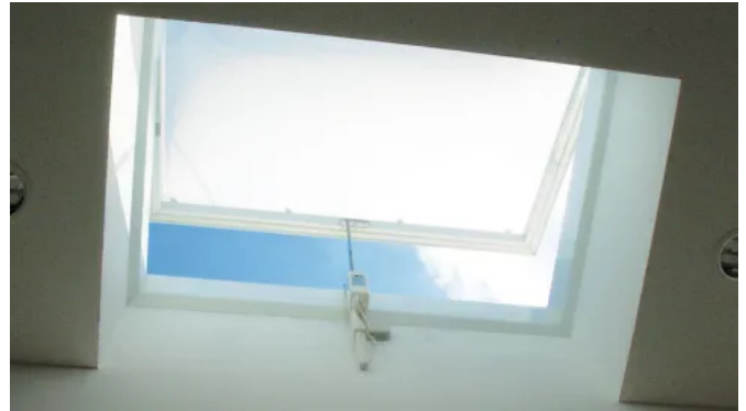
Treppenraum 24V RWA-SET gem. LBO

Weitere Informationen: Komfortlüftung und Rauchabzug für Lichtkuppeln