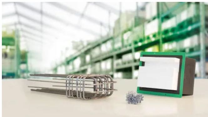
Trittschallschutzelemente für Treppenläufe und -podeste SINTON®

Die Trittschalldämmelemente SINTON® verhindern die Schallübertragung zwischen Treppen, Podesten oder Loggien und den angrenzenden Bereichen. Vom Treppenlauf über Treppenpodeste bis hin zur Wand, mit unterschiedlichen Produktausführungen werden Lärmbeeinträchtigungen in benachbarten Räumen oder Gebäuden gesenkt. Außerdem übertragen die meisten Dämmelemente zum einen Lasten oder Querkräfte und zum anderen, erhöhen sie die Wärmedämmung. In Kombination mit den passenden Zubehörteilen sind die Trittschallelemente somit die erste Wahl für jeden Aufgang.