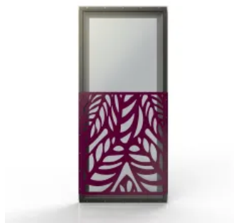
Prallscheibe AER kombiniert mit Absturzsicherungssystemen TEMPLATE

Die Prallscheibe ermöglicht die Kombination mit verschiedenen Absturzsicherungssystemen. So lassen sich auch einzelne Fenster trotz notwendiger Schallschutzmaßnahmen harmonisch in die bestehende Architektur der Fassade integrieren.