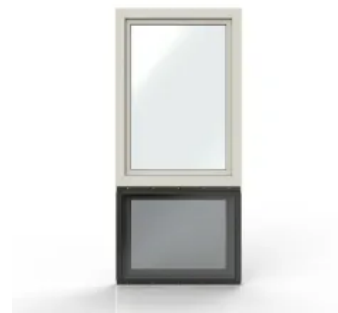
Beispiel teilintegrierte Lösung bei geteiltem Fenster