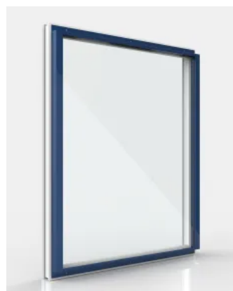
Fenster mit Prallscheibe AER

Mit der Prallscheibe AER werden Fenster unkompliziert schallgedämmt und bei Bedarf absturzsichernd ausgestattet. Die Systemlösung wird individuell an das Fenster angepasst und mit geprüften Befestigungsmitteln am Fensterrahmen angebracht. So können einzelne Fenster ebenso wie die gesamte Fensterfassade in puncto Schallschutz optimiert werden. Die Prallscheibenlösung ist sowohl für den Neubau als auch für Gebäude geeignet, an denen nachträglich eine Luftschalldämmung notwendig wird.