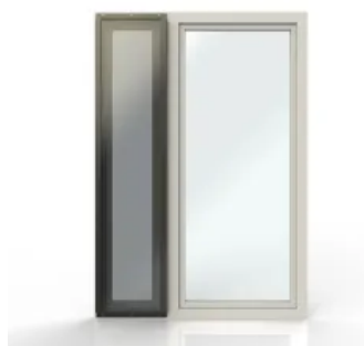
Beispiel teilintegrierte Lösung bei zweiflügeligem Fenster

Die Prallscheibe lässt sich als Teilelement bei individuellen Schallschutzlösungen integrieren. Beispielsweise mit mehrflügeligen oder geteilten Fenstern, die aus Schallschutzfenster und einem zu öffnenden Teilflügel inkl. schalldämmender Prallscheibe bestehen. So wird der Schallschutzwert optimiert, ein Schalldämmlüfter unnötig und die Frischluftzufuhr kann zusätzlich maximiert werden. Bei Bedarf kann die Prallscheibe zudem die absturzsichernde Funktion übernehmen.