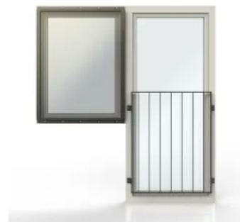
Prallscheibe AER kombiniert mit Absturzsicherungssystemen SIMPLUM