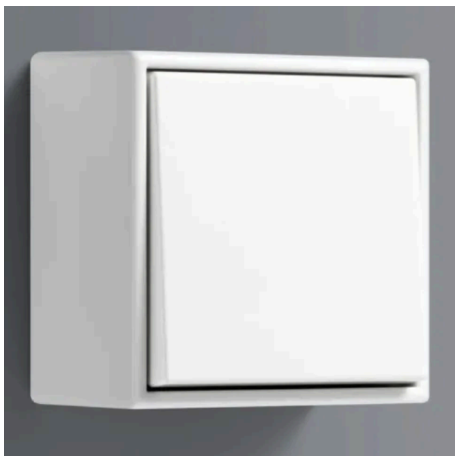
LS CUBE in Alpinweiß: Cradle-to-Cradle zertifiziert

Kunststoff in den Farben Weiß, Alpinweiß, Schneeweiß matt, Schwarz, Graphitschwarz matt, Aluminium, Edelstahl sowie in den Farben von Les Couleurs® Le Corbusier