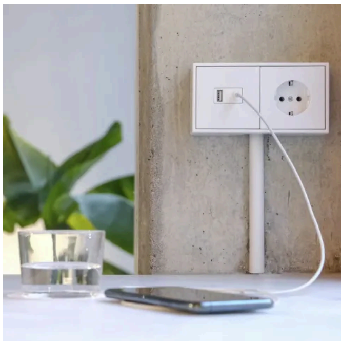
Schalterprogramm LS CUBE