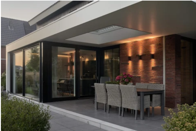
Wohnhaus Sneek, Architekt: Heeren 3 Architecten

Weiterführende Informationen zu GEALAN-SMOOVIO