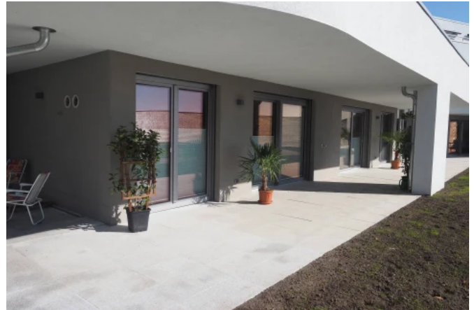
Wohnanlage Plauen, Architekt: Kayser + Németh - Architekten und Ingenieure Leipzig