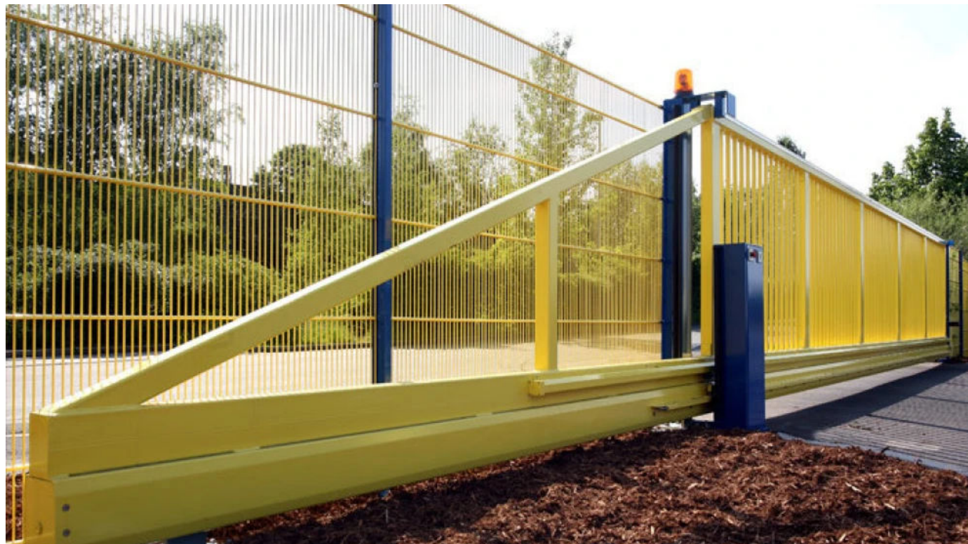
Schiebetor Atlas 2