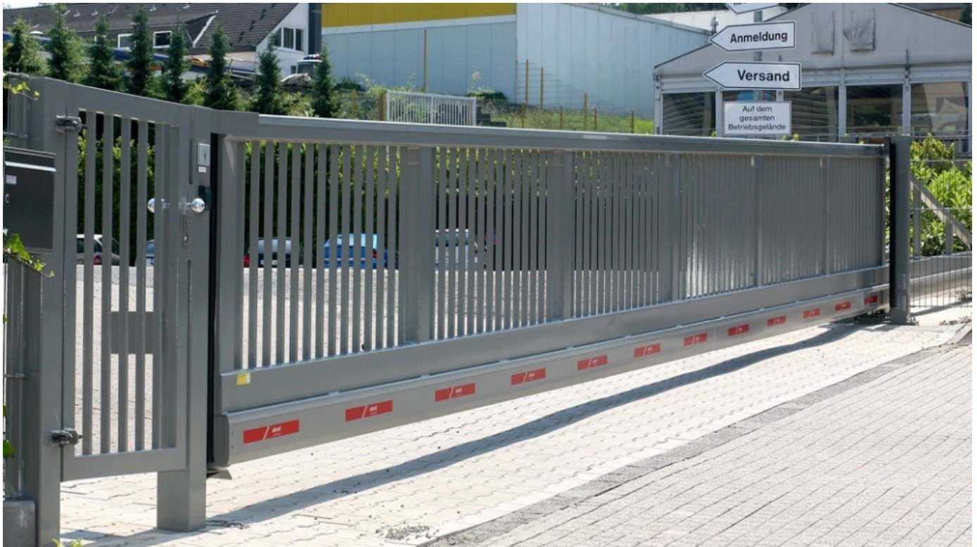
Schiebetor Atlas 1