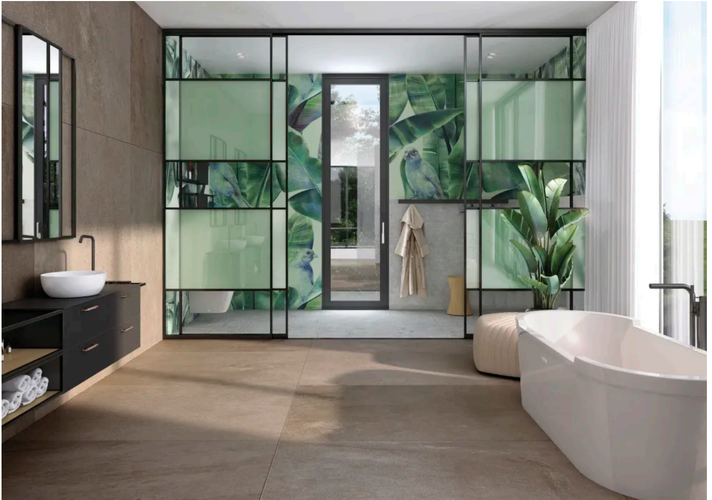
Schiebetürsystem als Raumtrenner

Aus der Serie Trennwand- und Raumgestaltungssysteme von Schüco Interior Systems