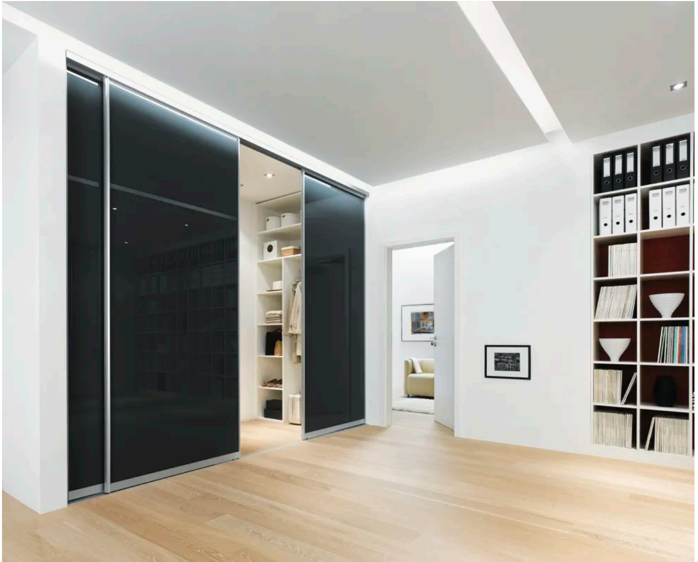
Schüco MST als Schiebetürsystem für begehbare Kleiderschränke

Aus der Serie Trennwand- und Raumgestaltungssysteme von Schüco Interior Systems