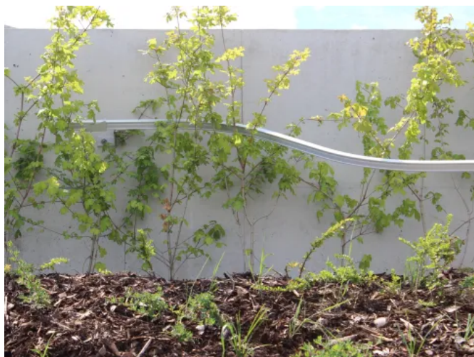
LUX-top® FSA 2010 – H