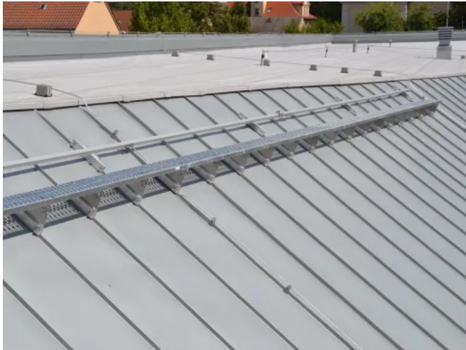
LUX-top® FSA 2010 – H

Aus der Serie Absturzsicherungen LUX-top® von ST QUADRAT Fall Protection S.A.