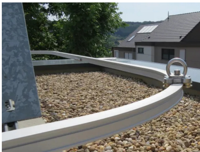
LUX-top® FSA 2010 – H