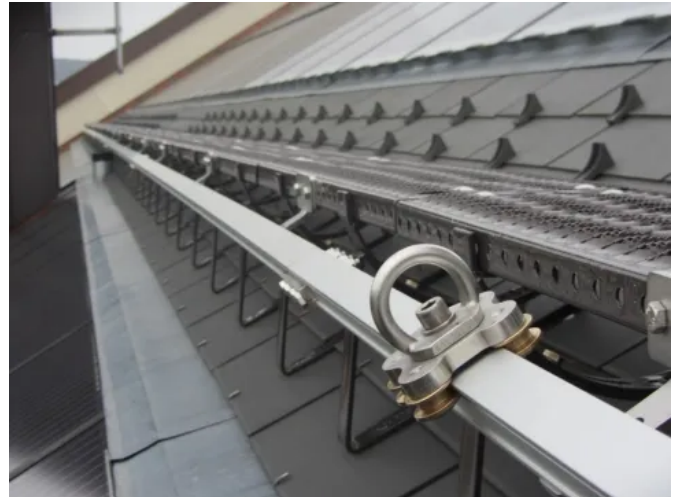
LUX-top® FSA 2010 – H