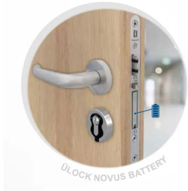
Ü-Lock Novus Battery: Batteriebetriebenes Elektronikschloss mit Zutrittskontrolle