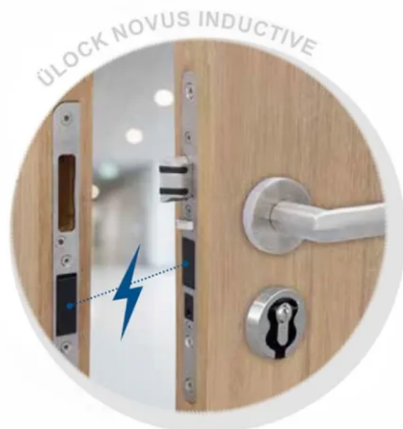
Ü-Lock Novus Inductive: Induktiv geladenes Elektronikschloss mit Zutrittskontrolle