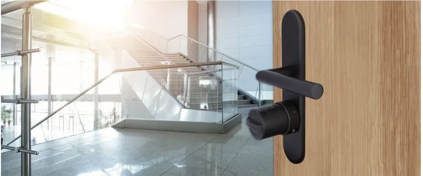
Motorisiertes Smartlock mit integriertem Bluetooth

Die automatische Ansteuerung erfolgt mittels Funkhandsender, Funktastatur, Fingerabdruckleser mit integrierter Tastatur oder das Smartphone (Bluetooth). Einmalige Tastaturcodes können vom Administrator einfach von unterwegs gesendet werden.