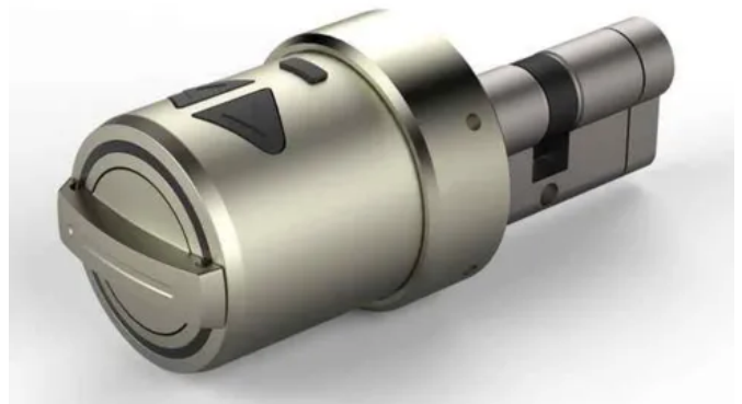
ÜTopic: Wiederaufladbarer Motorzylinder mit Zutrittskontrolle