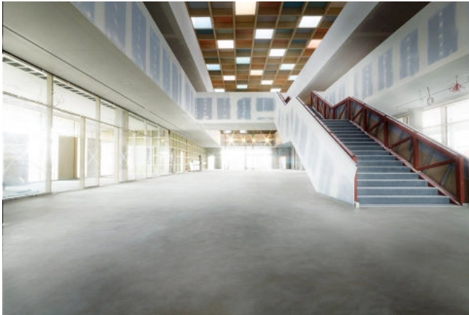
Beim Neubau des Gymnasiums in Lappersdorf musste ein hochstrapazierfähiger Estrich verlegt werden: UZIN SC 980 Schnellzementestrich kam zum Einsatz.

Aus der Serie Schnellestrich, Leichtestrich, Estrichsanierung von Uzin Utz