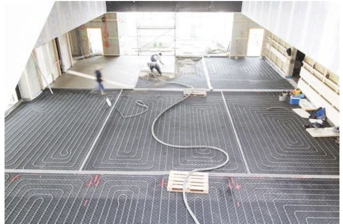
Auf 7.000 m 2 war der Estrich als Heizestrich mit integrierter Fußbodenheizung innerhalb kürzester Zeit und mit perfekter Ebenheit zu verlegen.