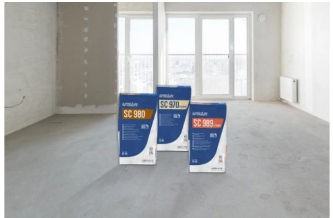
UZIN Schnellzemente sind geeignet für schnell erhärtende Estriche nach DIN 18560.