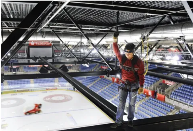
Die Seilsicherungs-Systeme ABS-Lock SYS kommen in Industrie- oder Veranstaltungshallen, auf Dächern oder an Kranbahnen zum Einsatz.

Aus der Serie Absturzsicherungssysteme von ABS Safety