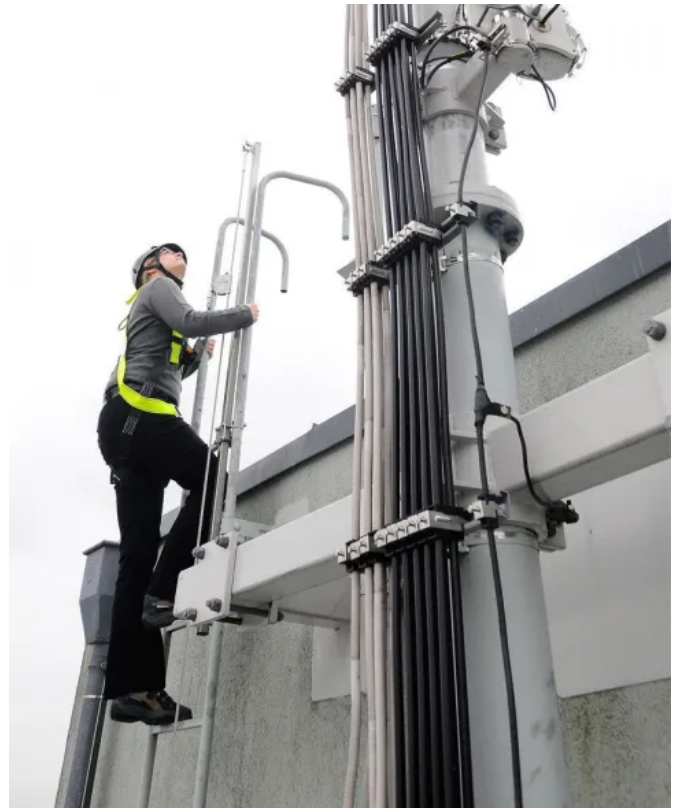
Vertikale Steigschutzeinrichtung mit Edelstahlführung und mitlaufendem Auffanggerät SafetyHike®