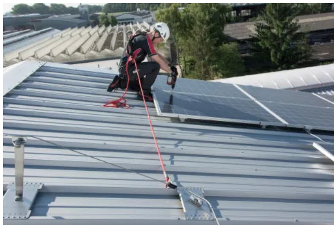
ABS-Lock SYS Seilsicherungssysteme sind optimal, wenn der Arbeitsraum auf Dächern durch PV-Anlagen, Lichtkuppeln oder RWAs eingeschränkt ist.