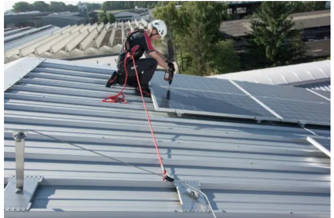
ABS-Lock SYS Seilsicherungs-Systeme sind optimal, wenn der Arbeitsraum auf Dächern durch PV-Anlagen, Lichtkuppeln oder RWAs eingeschränkt ist.