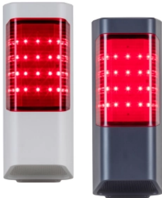
Signalgebern hiflac