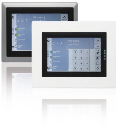
BT 800

Das Bedienteil BT 800 Funktionen ermöglicht folgende Funktionen