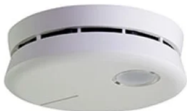
Funk Rauchwarnmelder