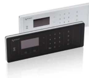
Funk-Bedienteil FBT 250

Das FBT 250 ermöglicht die gezielte Bedienung aller Sicherungsbereiche über die integrierte Tastatur oder über den integrierten RFID-Leser mit Mifare DESFire Transpondern (mit oder ohne AES-Verschlüsselung).