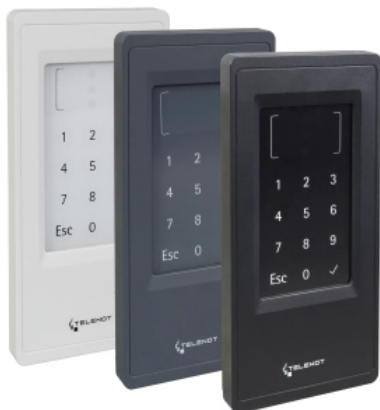
Zutrittskontrollleser cryptlock BLM 10 D

Aus der Serie Alarmanlagen zum Schutz vor Überfall, Einbruch und Brand von Telenot Electronic