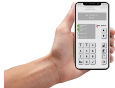
Alarmanlagen App BuildSec 4.0 © TELENOT