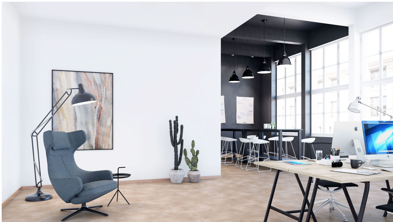
Sockelleisten und weitere Profile für den Innenausbau

Aus der Serie Sockelleisten und weitere Profile für den Innenausbau von Döllken Profiles