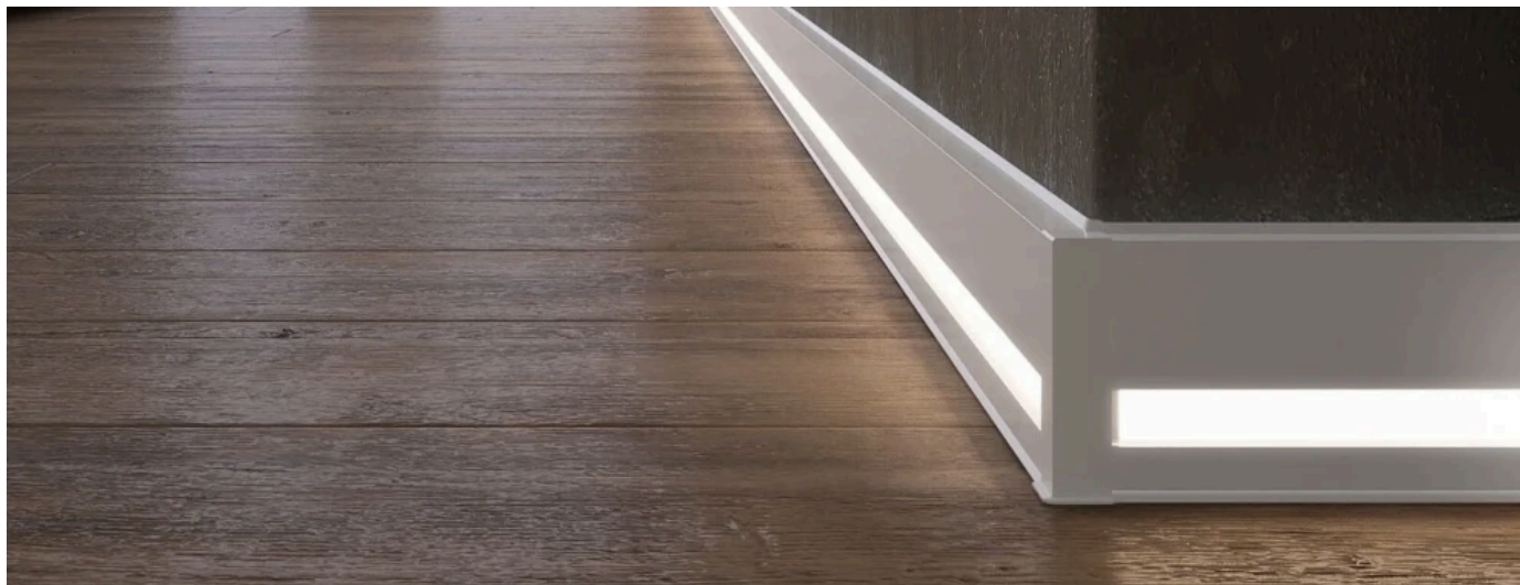
Lichtsystemleiste Cubica Light System 80

Aus der Serie Sockelleisten und weitere Profile für den Innenausbau von Döllken Profiles