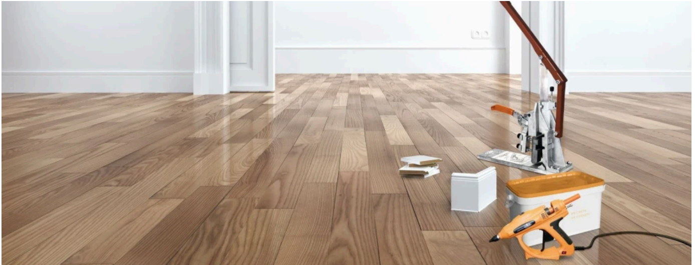
Werkzeuge und Klebesysteme

Döllken Profiles bietet ein umfassendes Sortiment an Systemwerkzeugen und ein Heißschmelzklebe-Befestigungssystem für die schnelle, saubere und sichere Befestigung. Außerdem ist eine Reihe verschiedener Trocken-Klebesysteme erhältlich.