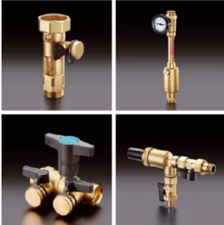
Umfangreiche Zubehörprogramm für die sichere und dauerhafte Installation von Solarthermieanlagen