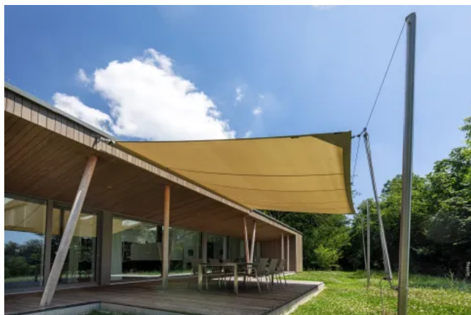
Vollautomatisch aufrollbares Sonnensegel SOLIDAY-CS