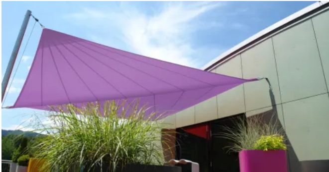
Semi-automatisch aufrollbares Sonnensegel SOLIDAY-X

Durch die patentierte SOLIDAY-Welle lässt sich das Sonnensegel manuell mit nur einem Seil aufspannen und durch Lösen des Seiles automatisch wieder einrollen.