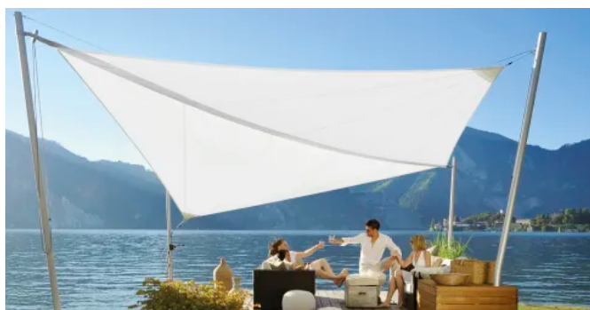
Manuell aufrollbares Sonnensegel SOLIDAY-A