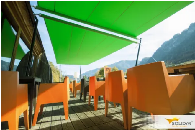
Vollautomatisch ausziehbares Sonnensegel SOLIDAY-CS Twin