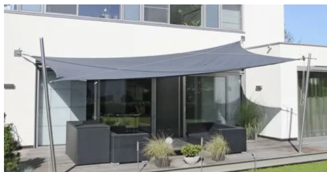
Manuell aufrollbares Sonnensegel SOLIDAY-M