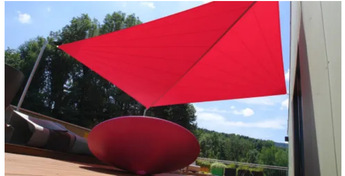
Semi-automatisch aufrollbares Sonnensegel SOLIDAY-X