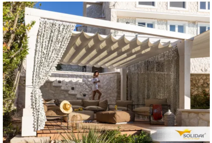
Raffbare Sonnensegel RAFF-M und RAFF-C