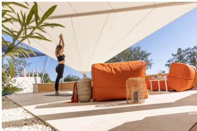
Vollautomatisch aufrollbares Sonnensegel SOLIDAY-C