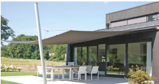
Semi-automatisch aufrollbares Sonnensegel SOLIDAY-XS

SOLIDAY-XS lässt sich mittels einer selbstaufrollenden Welle manuell von der Wand weg über einen Auszug von 6 m und einer Fläche von bis zu 35 m 2 aufspannen. Mittels besonderer Verspannungstechnik lassen sich die vor dem Segel stehenden Masten bzw. Befestigungspunkte außerhalb der Segelecken setzen. Dadurch wird ein freier Blick nach vorn ermöglicht.