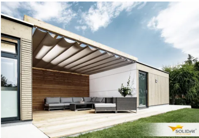
Raffbare Sonnensegel RAFF-M und RAFF-C