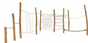
Niedrigseilgärten - Kletter- und Hangelanlage "Spiderman"