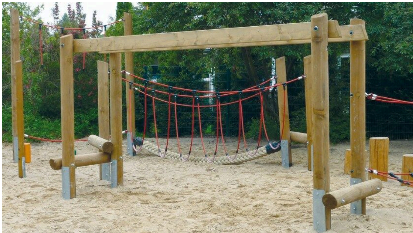
Variable Spielgeräte aus Holz.

Aus der Serie Spielplatz- und Spielanlagengeräte von HST-Spielgeräte