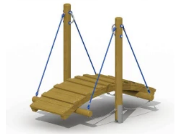
Abenteurpfad - Schwebelücke