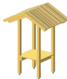
Spielskeln - Turm mit Dach