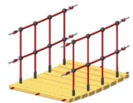
Spielskeln - Wackelbrücke