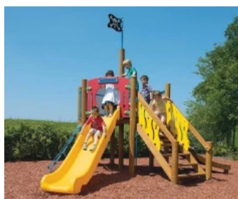
Variable Spielsysteme - Klettergerüst Seestern