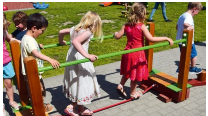
Abenteuerpfad für Kleinkinder