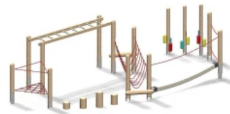
Niedrigseilgärten - Warendorf