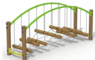
Abenteurpfad - Balkenbrücke