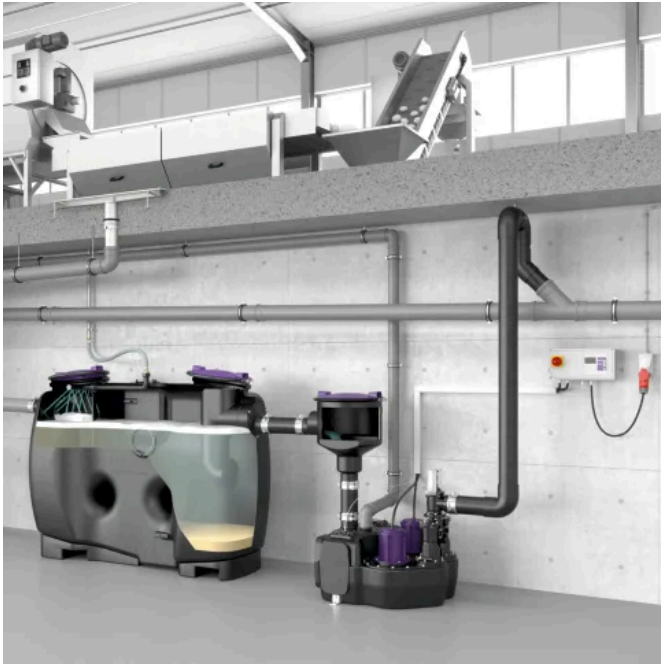
Stärkeabscheider EasyStarch free NG 2 für die Freiaufstellung

Aus der Serie Abscheidetechnik von KESSEL Entwässerungstechnik