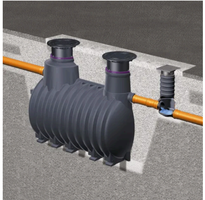
Stärkeabscheider EasyStarch ground NG 2 für den Erdbau