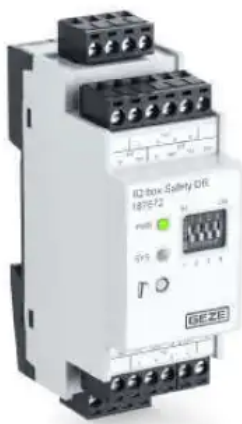
IQ box Safety Sicherheitsschaltmodul