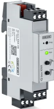
IQ box KNX Schnittstellenmodul

Aus der Serie Fenster: Antriebe, Öffnungs- und Verriegelungssysteme, Steuerungen für RWA von GEZE