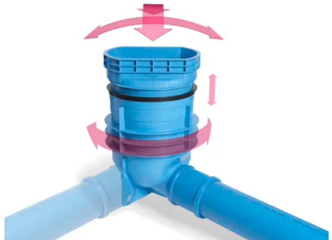
Der Straßenablauf aus Polypropylen ist flexibel an jede Einbausituation anpassbar