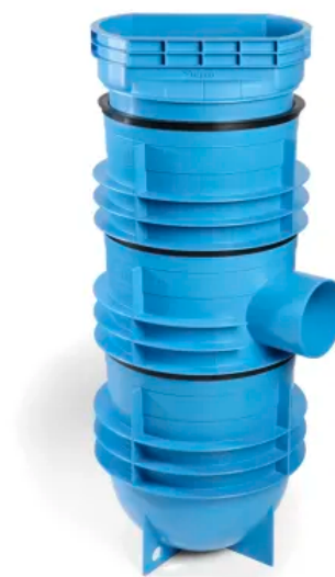
RAINSPOT mehrteilig, für Aufsatz 300 x 500 mm

Weitere Informationen zum RAINSPOT Straßenablauf