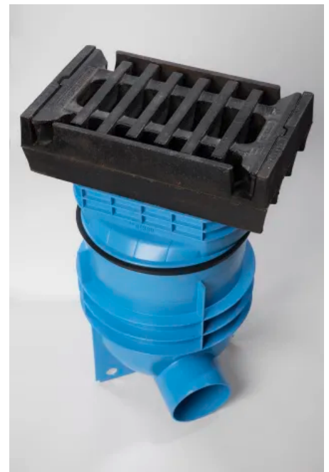
RAINSPOT Straßenablauf mit Aufsatz