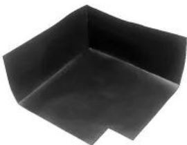
DELTA®-MAUERWERKSECKE, Ausführung Innen

Formteil für die problemlose und passgenaue Herstellung von Innen- und Außenecken.