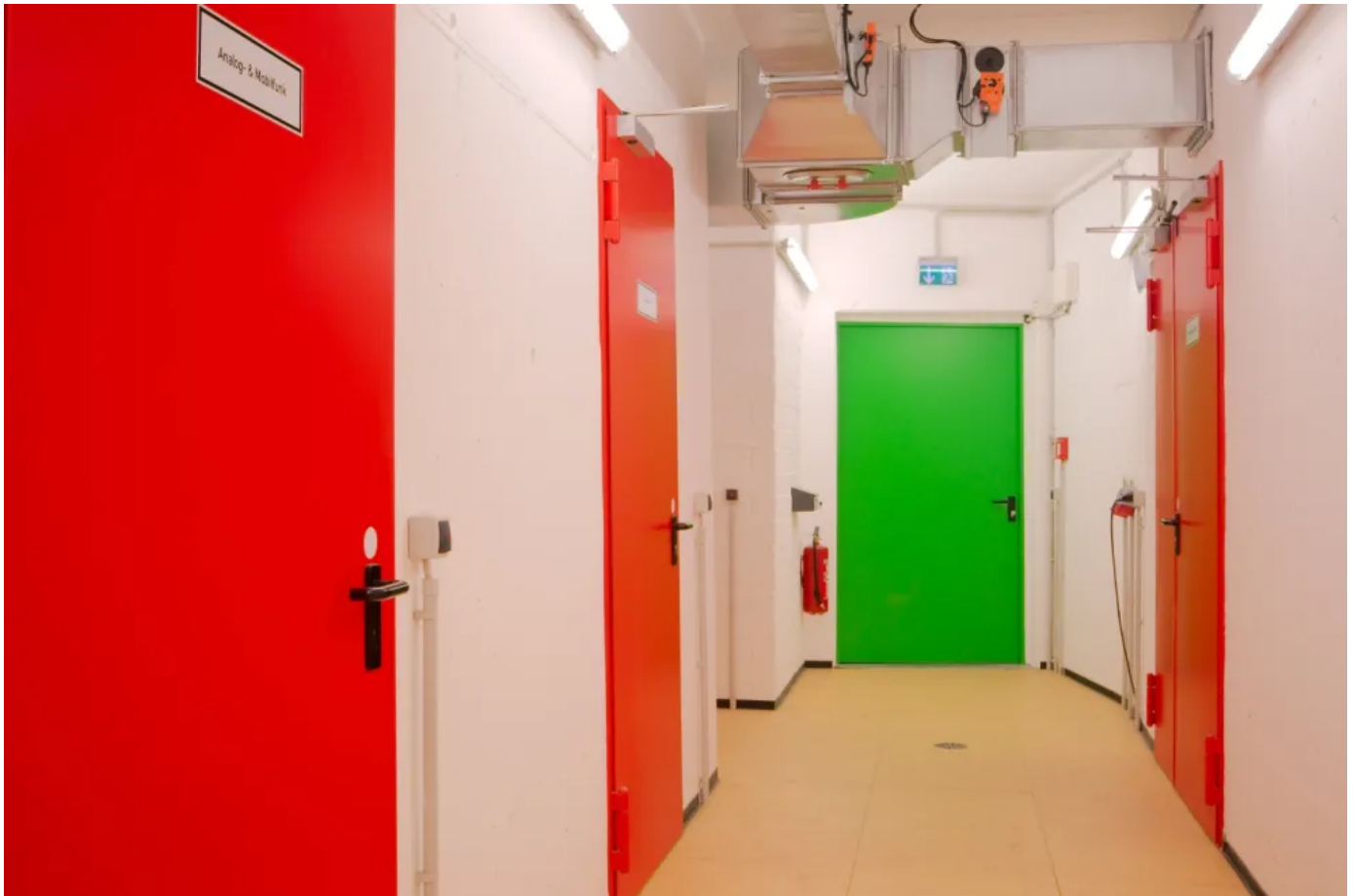
Feuerhemmende und rauchdichte Stahltür T 30-1-RS „System Schröders TSN-1“ Tunnel Kö-Bogen, Düsseldorf