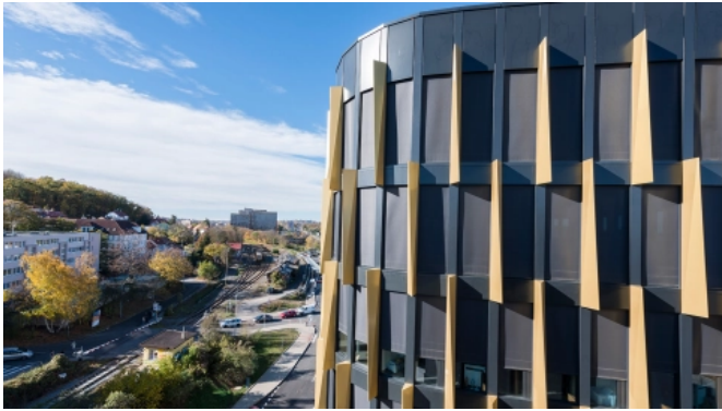
Gebäudekomplex AFI Vokovice in Prag