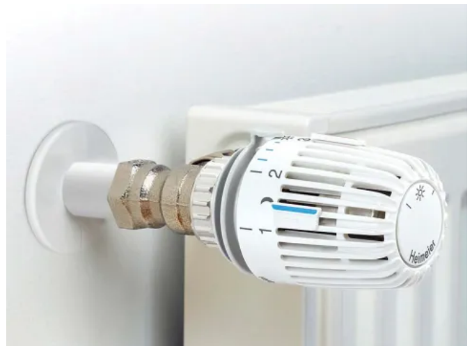
IMI HEIMEIER Thermostat-Köpfe stehen für zuverlässige, langlebige und energiesparende Raumtemperaturregelung.