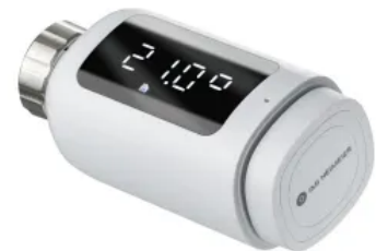
HeimSync ist der smarte Thermostat-Kopf von IMI Heimeier in Bluetooth Version.