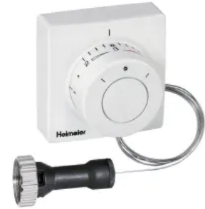
Der Thermostat-Kopf F ist ein Feinesteller mit eingebautem Fühler.