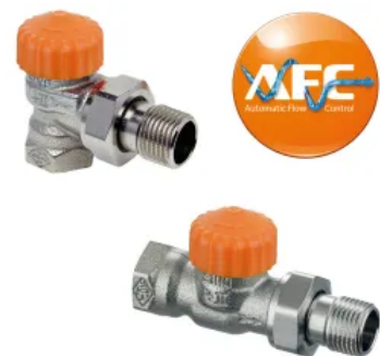
Das Thermostat-Ventilunterteil Eclipse regelt den Durchfluss automatisch — hydraulischer Abgleich mit einem Dreh