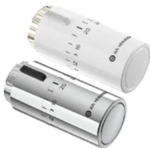
Der neue Thermostat-Kopf Halo kombiniert Präzisionsregelung und ansprechendes Design.