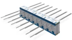
Isokorb® in Ausführungsvariante ID

Weitere Informationen: Isokorb® CXT Typ A