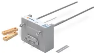
Schöck Isokorb® RT Typ SK

Aus der Serie Tragende Wärme- und Trittschalldämmelemente, Bewehrung, Fassadenbefestigung von Schöck Bauteile