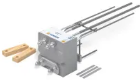
Isokorb® XT Typ SK

Weitere Informationen: Isokorb® in Ausführungsvariante ID