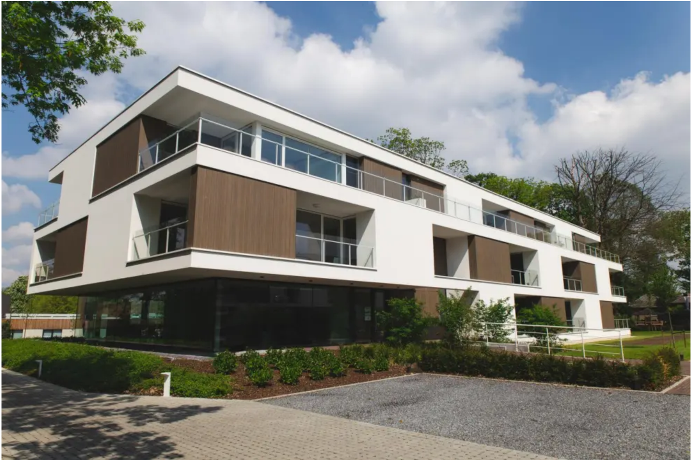
Pura NFC®, Altengerechte Wohnungen mit Betreuung, Ort: Bree (Belgien)