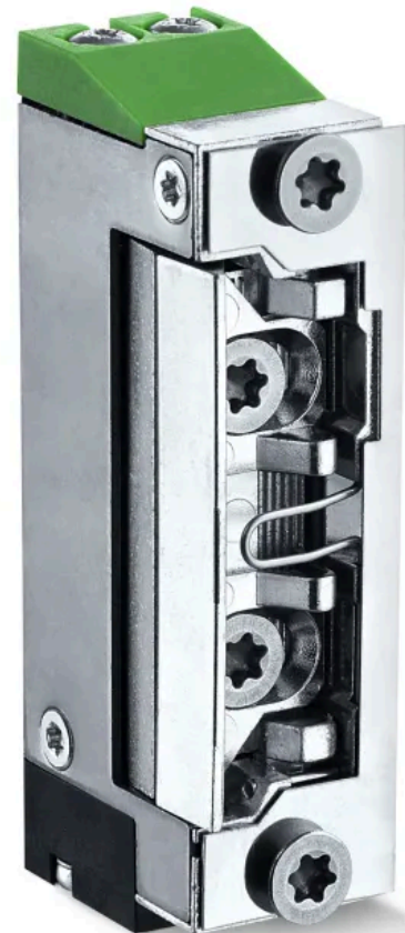
FT501--E – Feuerschutz-Türöffner