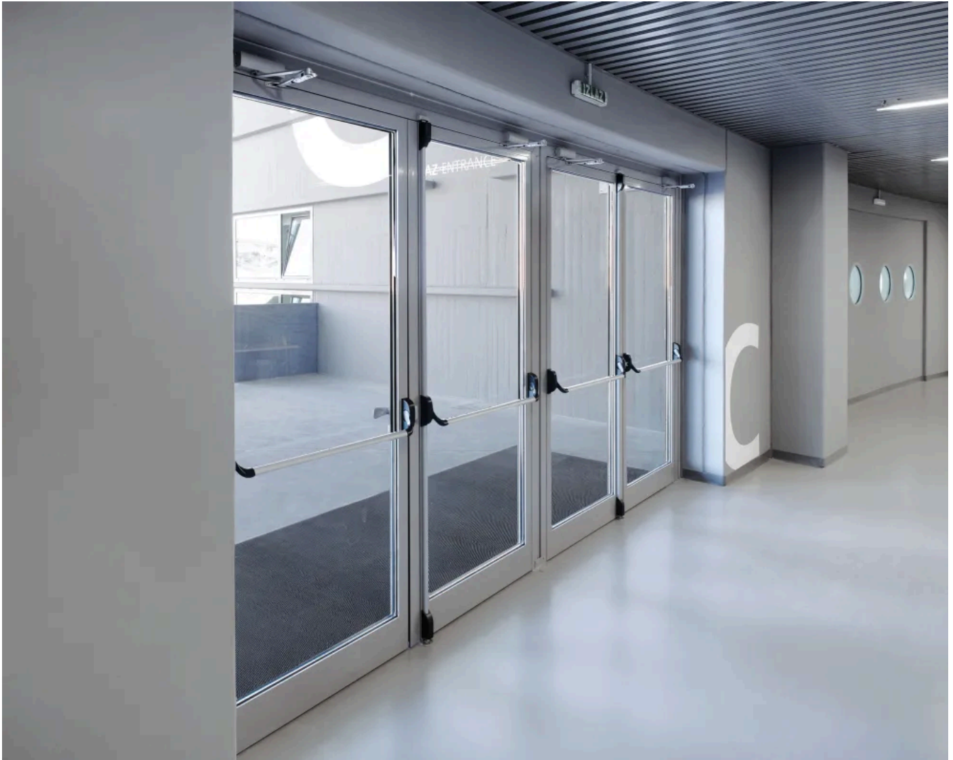
Gestängentürenschießer – Sports Hall, Zadar, Kroatien