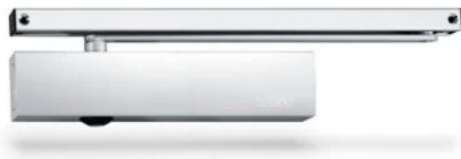
TS 5000 L SoftClose Gleitschienentürschließer Bandgegenseite für einflügelige Türen bis 1400 mm Flügelbreite mit Endschlag/-bremsfunktion

Aus der Serie Drehtüren: Antriebe, Türschließer, Feststellanlagen und Türkomfort von GEZE