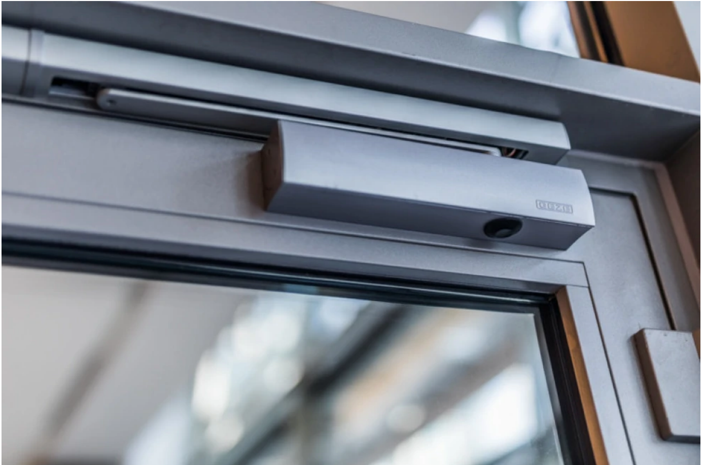
TS 5000 ECLINE Gleitschientürschließer