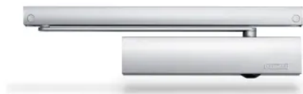
TS 5000 Ecline Gleitschienentürschließer – für barrierefreie einflügelige Türen bis 1250 mm Flügelbreite mit Öffnungsunterstützung