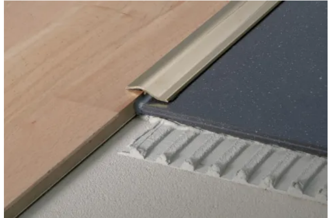
BLANKE NIVEAU Ausgleichsschiene

Technisches Datenblatt BLANKE HÖHENAUSGLEICHSPROFIL