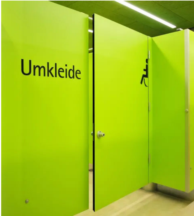
SANA Umkleidekabine - rollstuhlgerechte Ausführung

Aus der Serie Umkleidekabinen und Wechselkabinen von SANA Trennwandbau