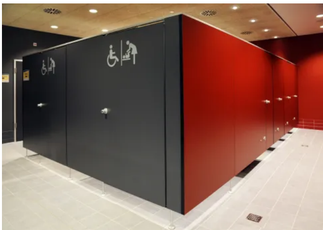
SANA Umkleidekabine - barrierefreie Ausführungen

Auch für die Ansprüche an die Barrierefreiheit in öffentlichen Einrichtungen, Bädern, Schulen und Betrieben bietet SANA unterschiedliche und individuelle Lösungen. Diese werden in enger Zusammenarbeit mit Planern und Bauherren verwirklicht.