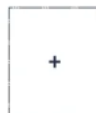
Weitere Farben, Holzdekore und Digitaldruck auf Anfrage.