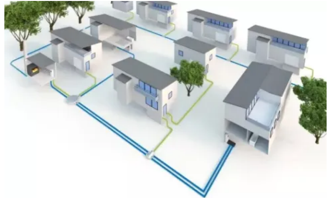
Uponor Ecoflex Thermo für Nahwärmenetze