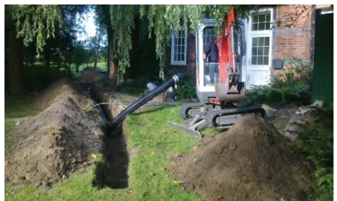
Uponor Ecoflex Aqua

Das flexible, vorgedämmte Rohrsystem Uponor Ecoflex Aqua ist eine sichere Wahl, um Wärme und warmes Trinkwasser von einem Gebäude in das nächste zu transportieren. Die mehrlagige Konstruktion und die spezielle Ausbildung der Rohrgeometrie verleihen dem Rohrsystem eine besondere Flexibilität. Das stabile, schlagfeste und dennoch flexible Mantelrohr schützt die Dämmschichten und Mediumrohre vor äußeren Einflüssen und verfügt über eine hohe statische Belastungsfähigkeit. Die Rohre werden direkt auf ein steinfreies Sandbett im Rohrgraben gelegt. Hindernisse und Barrieren können dabei einfach umgangen werden. Eine dicke, geschlossenzellige Dämmschicht sorgt für minimale Wärmeverluste, schont auf diese Weise die Umwelt und ermöglicht niedrige Gräben. Ohne Beanspruchung durch Verkehrslasten ist eine Mindestsandüberdeckung von nur 40 cm erforderlich (örtliche Frostgrenzen sind hierbei unberücksichtigt) – es sind also keine umfangreichen Erdarbeiten notwendig.