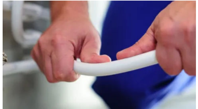
Die gute Biegebarkeit erleichtert die Installation und spart Fittings.