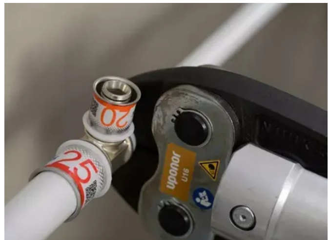
Schnell installiert in 3 Schritten: Rohr zurechtschneiden, Fitting einsetzen, Fitting pressen. Die sofortige Leckageanzeige bei unkorrekter Verpressung vermeidet Installationsschäden.