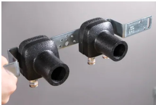
Uponor S-Press PLUS Schallschutzset

Eventuelles Leckagewasser wird gezielt aufgefangen und an der Vorderseite der Wand abgeleitet!