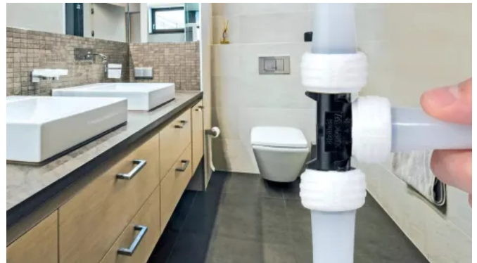
Uponor PE-Xa Kunststoffrohr