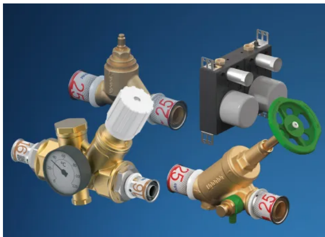
Uponor S-Press PLUS Ventile

Der Einbau der Ventile erfolgt wie gewohnt effizient in nur drei Installationsschritten – Rohr ablängen, einstecken, pressen – fertig!