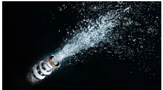
Uponor S-Press PLUS Pressverbinder

Einsatzbereich für Heizung: max. zulässige Dauerbetriebstemperatur von 80 °C bei max. Dauerbetriebsdruck von 10 bar