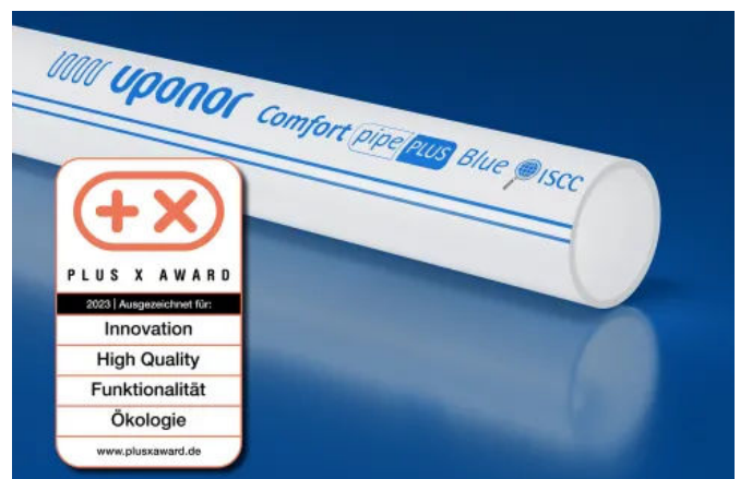
Uponor PEX Pipes Blue