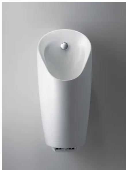
Das Urinal Preda wurde mit dem iF Design Award 2016 in der Kategorie Produkt ausgezeichnet.