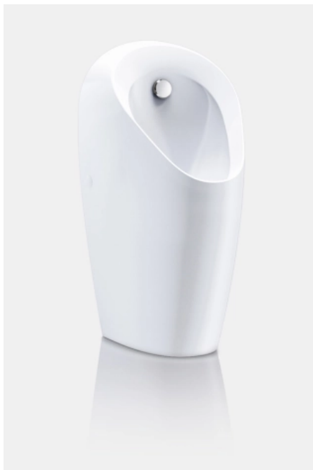
Geberit Urinalkeramik Selva - robust für stark frequentierte Bereiche