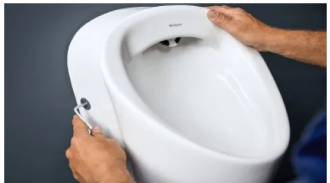
Einfache Installation eines Renova Urinals

Geberit Renova Urinale verfügen über einen innovativen Spülverteiler. Dieser ist nahezu unsichtbar, einfach zu montieren und sorgt dafür, dass das Urinal bereits ab einem halben Liter Wasser gründlich und effizient ausgespült wird.