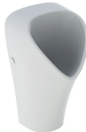
Geberit Narva für wasserlosen Betrieb