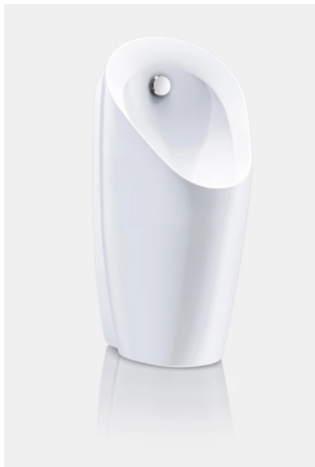
Geberit Urinalkeramik Preda - kompakt und elegant

Aus der Serie Waschtischarmaturen, Urinale und WC-Steuerungen von Geberit