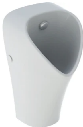
Geberit Narva mit Sprühkopf

Die spülrandlose Urinalkeramik ist mit einem Sprühkopf ausgestattet und kann wassersparend mit automatischer Spülung oder mit manueller Spülauslösung kombiniert werden. Der Sprühkopf ist ohne Abnehmen der Keramik von vorne austauschbar. Das Urinal Narva ist auch in einer Variante für den wasserlosen Betrieb erhältlich.