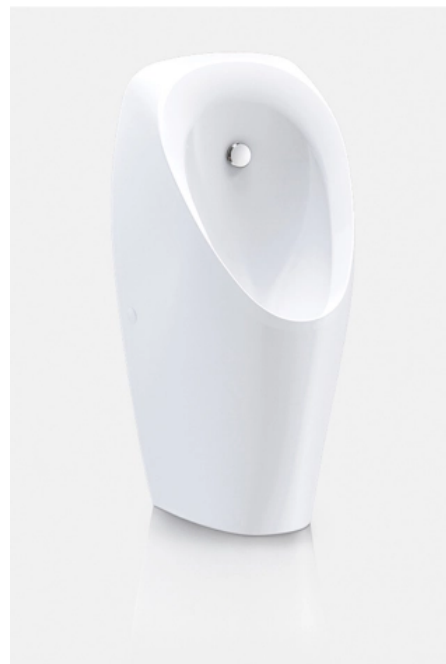
Geberit Tamina - die Maße passen für den Ersatz bestehender, großer Urinalkeramiken