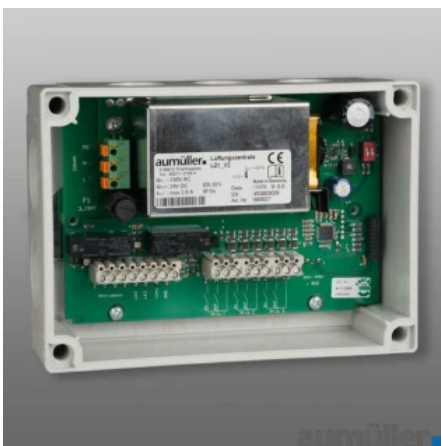
Netzteile & Steuerrelais