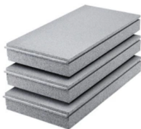
EPS Qju 3810

Im Systemaufbau geprüfte Hartschaum-Dämmplatte für den Einsatz im Brillux WDV-System EPS Qju.