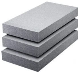
EPS Prime 3870