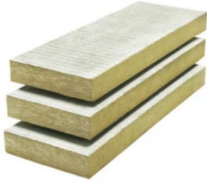
MW Top Dämmplatte DLF 3834

Im Systemaufbau geprüfte Dämmplatte für den Einsatz im Brillux WDV-System MW Top und MW Ecotop.