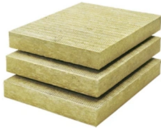
MW Top Dämmplatte 3586

Weitere Informationen im Praxismerkblatt 3586 und Sicherheitsdatenblatt 3586