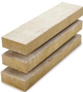
MW Top Brandriegel 3610

Nichtbrennbare, beidseitig beschichtete Steinwolle-Putzträgerplatte für den Einsatz als gebäudeumlaufender Brandriegel oder als Brandbarriere in den Brillux WDV-Systemen EPS Qju und EPS Prime.