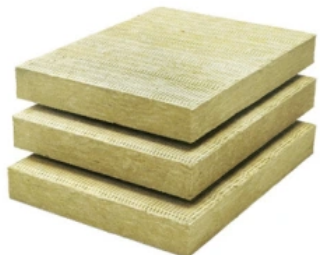
MW Top Laibungsplatte 3522