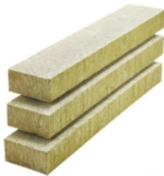
MW Top Lamelle 3611

Im Systemaufbau geprüfte Dämmplatte für den Einsatz im WDV-System MW Top und MW Ecotop. Die beidseitige Vorbeschichtung der Lamellen ermöglicht eine besonders rationelle Verarbeitung.