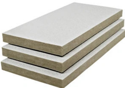
MW Top Dämmplatte LD 3890

Im Systemaufbau zugelassene Dämmplatte für den Einsatz im Brillux WDV-System MW Top und MW Ecotop.