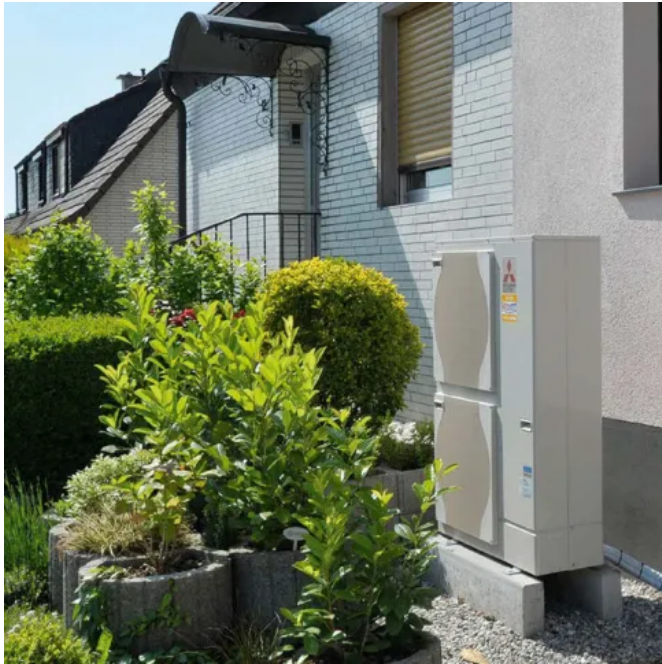
Ecodan Luft/Wasser - Wärmepumpensysteme

Aus der Serie Wärmepumpen von Mitsubishi Electric Europe B.V.