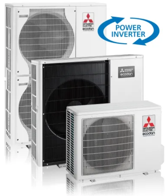
Ecodan Luft/Wasser Wärmepumpe, Außengerät mit Power Inverter

Power Inverter lassen sich sehr gut in bivalente Systeme integrieren. Die Kombination mit einem zweiten Wärmeerzeuger wird über den integrierten Wärmepumpenmanager unter verschiedenen Gesichtspunkten (Kosten, CO 2 -Einsparung, etc.) optimiert.