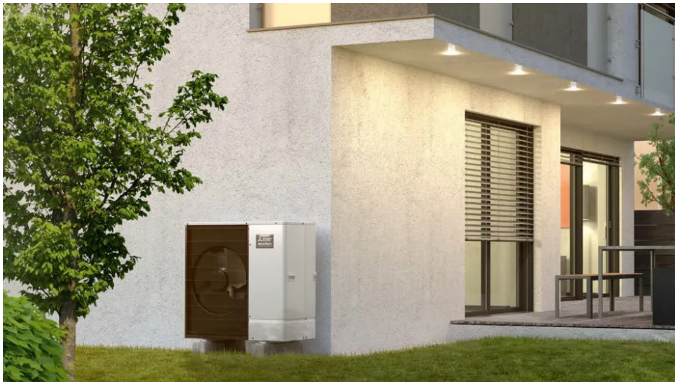
Das kompakte Ecodan Monoblock-System

Aus der Serie Wärmepumpen von Mitsubishi Electric Europe B.V.