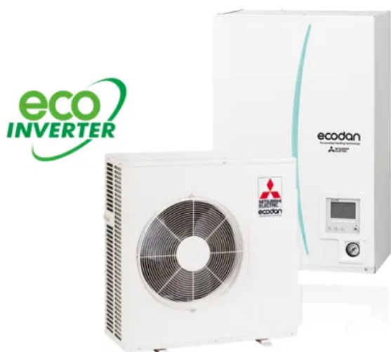
Ecodan Luft/Wasser Wärmepumpe, Außengerät mit Eco-Inverter

Die Eco Inverter Außengeräte sind besonders für Niedrigenergiehäuser geeignet. Der garantierte Einsatzbereich des Außenmoduls liegt zwischen -15 und +35 °C.