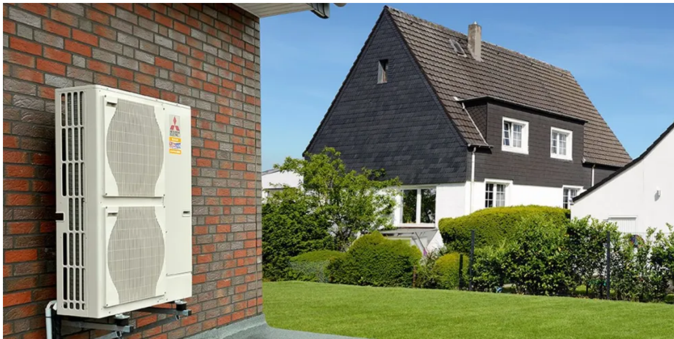
Ecodan Luft/Wasser Wärmepumpe, Außengerät mit Zubadan Inverter

Aus der Serie Wärmepumpen von Mitsubishi Electric Europe B.V.