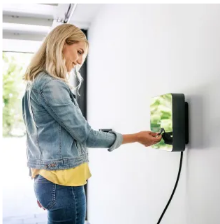
Mit einer Montageschiene lässt sich die Wallbox komfortabel und präzise an der Wand ausrichten.