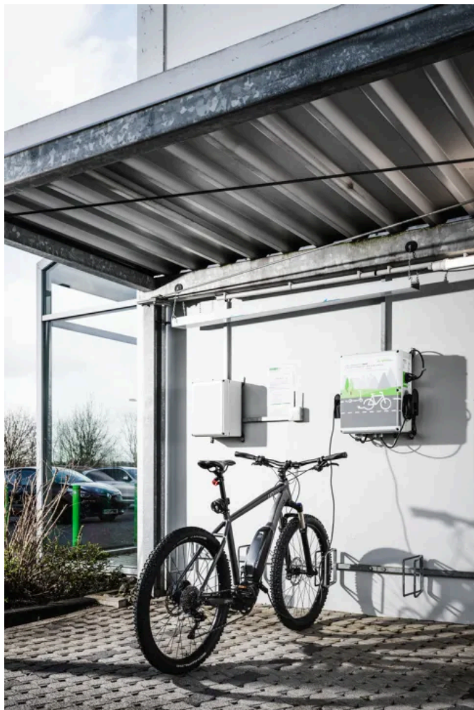
E-Bike-Ladestation von Spelsberg

Alles für das E-Bike: Spelsberg bietet Ladestationen mit integriertem Ladekabel sowie mit Schuko®-Steckdosen.