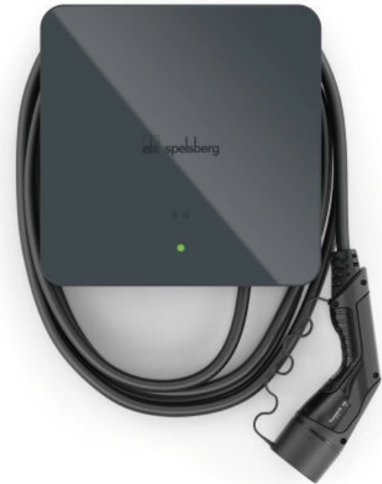
Spelsberg Wallbox Smart Pro

Mehr Informationen zur Spelsberg Wallbox Pure