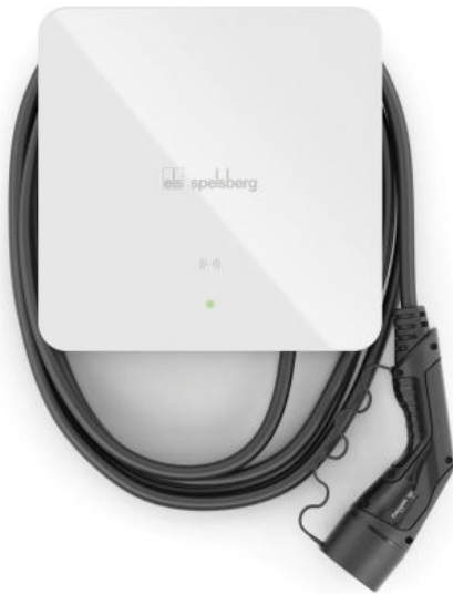
Spelsberg Wallbox Pure