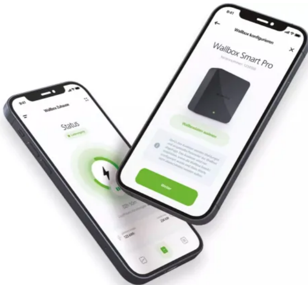
Spelsberg Wallbox App

Die Spelsberg Wallbox App gestaltet das Handling mit der Spelsberg Wallbox Pure oder Spelsberg Wallbox Smart Pro für Betreiber und Installateure gleichermaßen einfach.