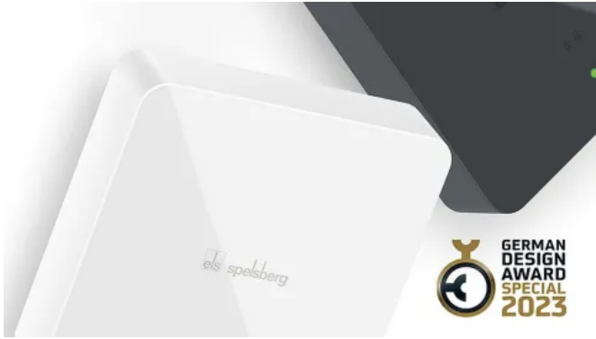
Preisgekröntes Design: Die Wallboxen Pure und Smart Pro von Spelsberg

Aus der Serie Wallboxen für Elektrofahrzeuge und Plug-in-Hybride von Spelsberg