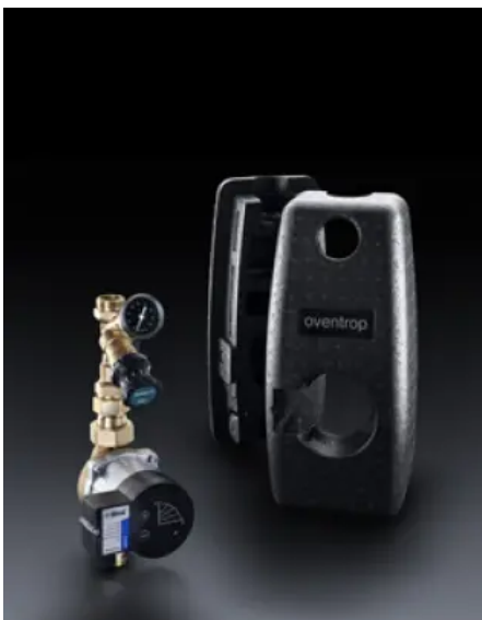
Zirkulationsstationen für Trinkwasser