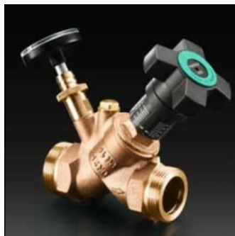
„Aquastrom C“ Strangregulierventil aus Rotguss mit Thermometer für die Einstellung der Restvolumenströme.