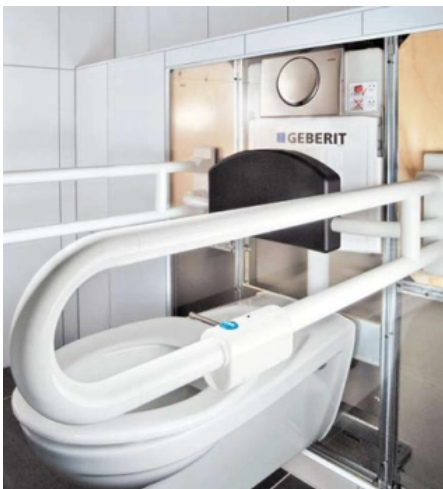
Spülauslösungen am Stütz-Klappgriff können per Funk, per IR-Signal oder per Kabel übermittelt werden.