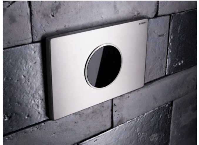
Berührungslose WC-Steuerung mit Betätigungsplatte Sigma10 Edelstahl

Für maximale Sicherheit bei Montage und Betrieb arbeiten die Geberit WC-Steuerungen mit Kleinspannung und verwechslungssicher ausgeführten Steckverbindungen. Individuelle Einstellungen lassen sich auch nachträglich mit dem Geberit Service-Handy vornehmen.