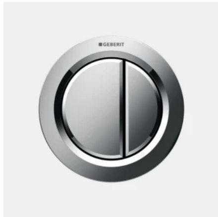
Geberit Fernbetätigung Typ 01