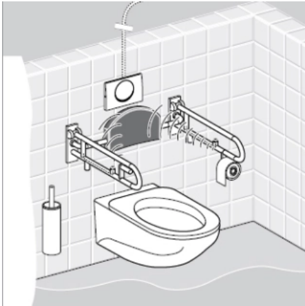
WC-Steuerung (Funk/Netz): Spülauslösung durch Aktivierung des Funksenders am Stütz-Klappgriff.

Aus der Serie Waschtischarmaturen, Urinale und WC-Steuerungen von Geberit