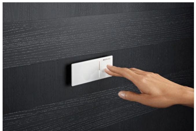
Geberit Fernbetätigung Typ 70

Die Geberit Fernbetätigung Typ 70 überzeugt mit den kleinen Abmessungen und hochwertiger Oberfläche. Die flache, rechteckige Platte wirkt leicht und scheint vor der Wand zu schweben. Für ihr schlichtes Design wurde die Fernbetätigung Typ 70 bereits mit dem Design Plus Award 2015 ausgezeichnet. Sie lehnt sich an das Design der Betätigungsplatte Sigma70 an und eignet sich zum Einsatz mit allen Geberit Unterputz-Spülkästen der Baureihen Sigma und Omega. Typ 70 gibt es in gebürstetem Edelstahl und mit Fronten aus Glas in den Trendfarben Weiß, Schwarz und Umbra.