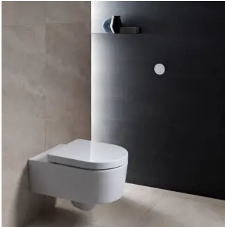
Geberit Fernbetätigung Typ 10

Aus der Serie Waschtischarmaturen, Urinale und WC-Steuerungen von Geberit