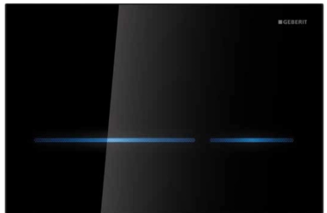
Berührungslose Betätigungsplatte Geberit Sigma80

Renommierte Designpreise bestätigen die perfekt gelungene Kombination aus Design und Funktion.