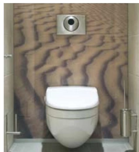
Geberit WC-Steuerungen mit elektronischer Spülauslösung, Betätigungsplatte Sigma 10

Durch dieses Komplettprogramm deckt Geberit auch die Anforderungen des senioren- und behindertengerechten Bauens (barrierefrei) ab.