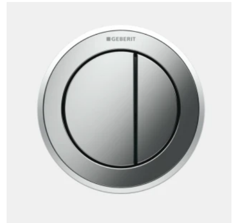
Geberit Fernbetätigung Typ 10

Die Geberit Fernbetätigung Typ 70 überzeugt mit den kleinen Abmessungen und hochwertiger Oberfläche. Die flache, rechteckige Platte wirkt leicht und scheint vor der Wand zu schweben. Für ihr schlichtes Design wurde die Fernbetätigung Typ 70 bereits mit dem Design Plus Award 2015 ausgezeichnet. Sie lehnt sich an das Design der Betätigungsplatte Sigma70 an und eignet sich zum Einsatz mit allen Geberit Unterputz-Spülkästen der Baureihen Sigma und Omega. Typ 70 gibt es in gebürstetem Edelstahl und mit Fronten aus Glas in den Trendfarben Weiß, Schwarz und Umbra.