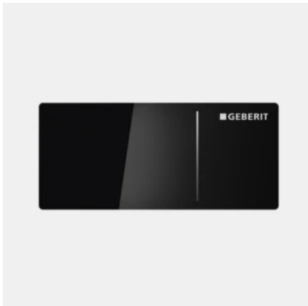
Geberit Fernbetätigung Typ 70