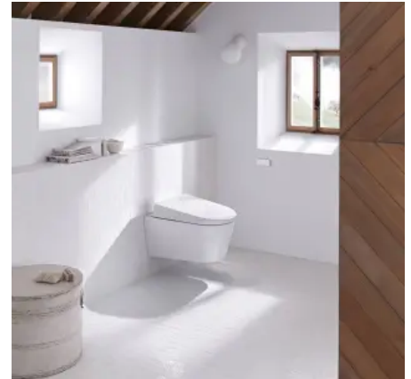
Flexibel und praktisch: Fernbetätigungen von Geberit lassen sich flexibel in die Badarchitektur integrieren.

Die drei Geberit Modelle Typ 01, Typ 10 und Typ 70 unterscheiden sich in Komfort und Design: