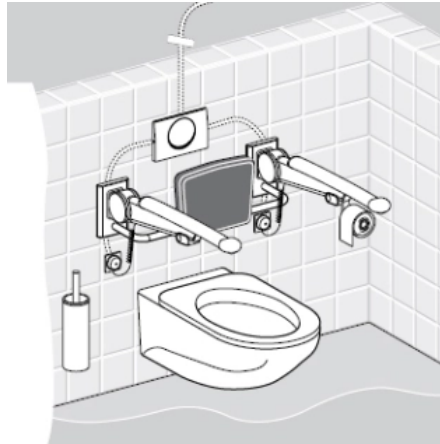
Geberit WC-Steuerung (Kabel/Netz): Spülauslösung durch Schließen des Stromkreislaufts zwischen Taster am Stütz-Klappgriff und WC-Steuerung.

Pneumatische Fernauslösung für WC-Anlagen Für Geberit UP-Spülkästen sind als kostengünstige Alternative pneumatische Fernauslösungen einsetzbar.