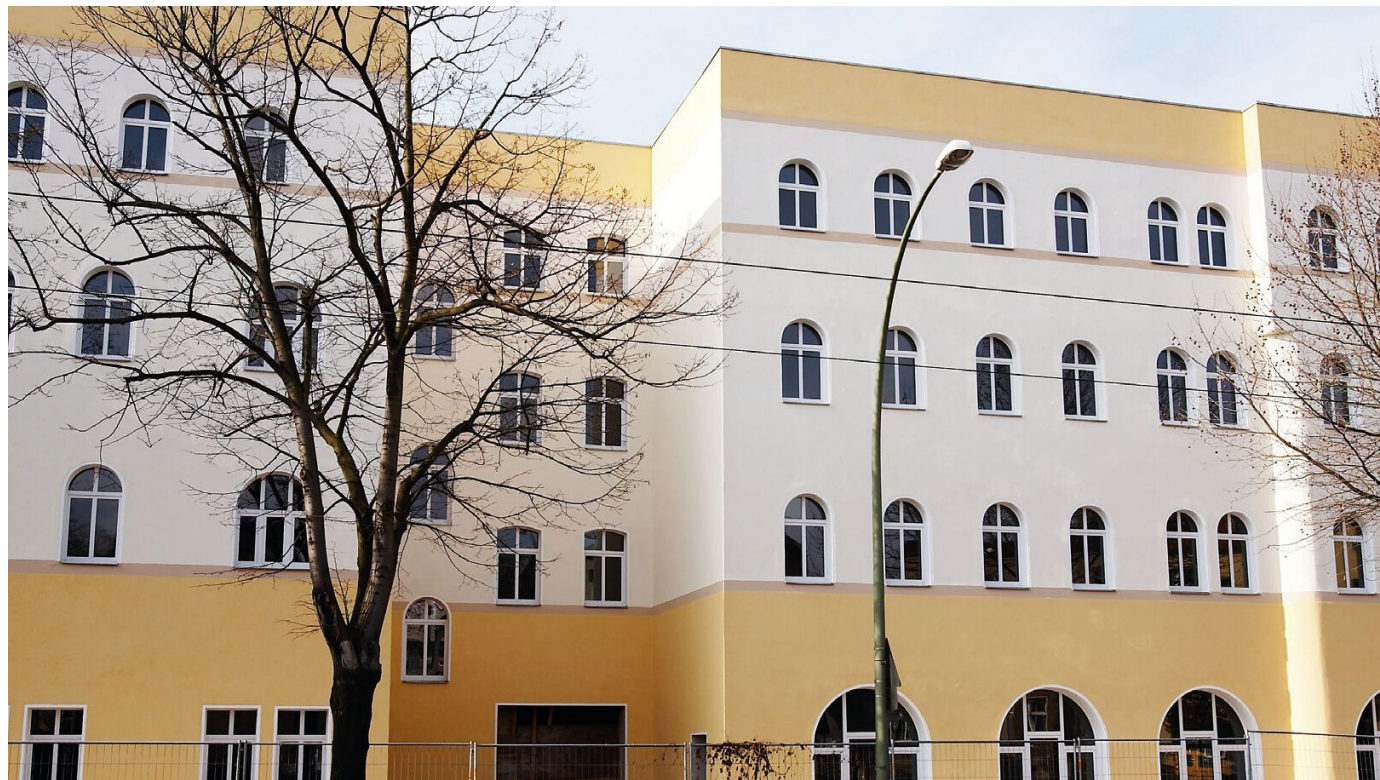
WDVS mit EPS-Dämmplatte und Putzaufbau

Aus der Serie Wärmedämmung / WDVS von Saint-Gobain Weber